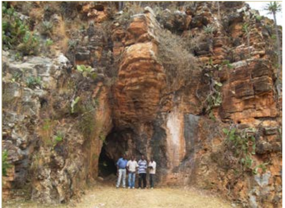
FIGURA 2. Gruta na Serra da Leba em rochas dolomíticas silicificadas com forte laminação de origem microbiana (Formação da Leba). De notar a vegetação espinhosa tão característica desta unidade carbonatada.”

Mas, entre todo este gigantesco enquadramento mesoscópico, é à escala macro e microscópica que se evidencia, numa perspetiva mais global, a geologia sedimentar da Formação da Leba. Tudo, “por culpa” da ocorrência de magníficas estruturas estromatolíticas (FIGURAS 3 E 4), testemunhos de atividade microbiana que terão dominado os ambientes marinhos proterozoicos, muito antes de se assistir à grande “explosão” da vida na Terra, a que marca o início do Fanerozoico. Com estromatólitos para diversos gostos, considerando as diferentes morfologias e aspetos diagenéticos fossilizados, estes corpos sedimentares são acompanhados de marcas de ondulação e por outros registos de um ambiente marinho muito superficial (oncólitos e oólitos), fazendo lembrar — com as devidas diferenças — , através do incontornável Princípio do Uniformitarismo, a célebre Baía dos Tubarões, na Austrália Ocidental: o “paraíso” dos estromatólitos atuais. Não fosse este, um dos Princípios da Geologia que melhor permite ao geólogo entender o passado a partir da observação e interpretação dos sistemas sedimentares atuais.