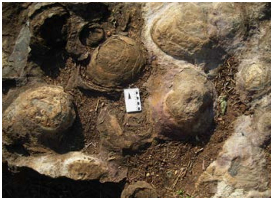
FIGURA 3. Cúpulas estromatolíticas muito bem preservadas em sedimentos de natureza dolomítica (Formação da Leba, Planalto da Humpata).