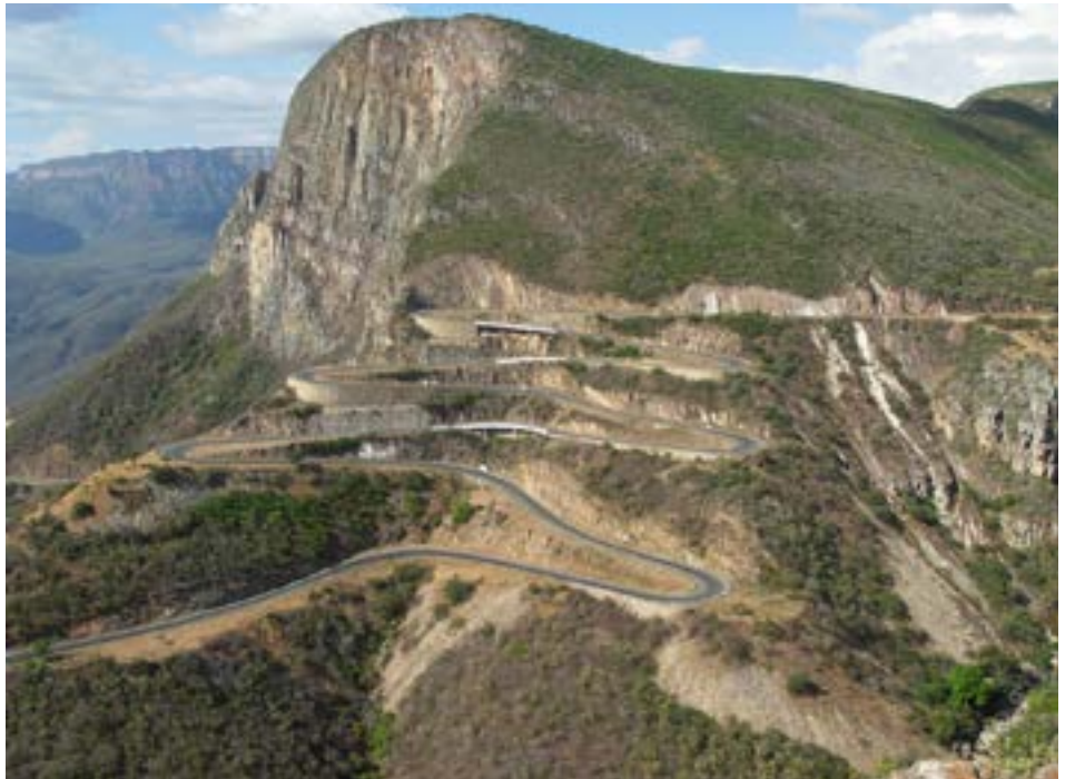
FIGURA 1. A imagem clássica do miradouro da Serra da Leba, conjugando aspetos da geomorfologia com a famosa "Estrada da Leba".

Entre toda a sucessão sedimentar, predominantemente siliciclástica e com algumas intercalações vulcanoclásticas ácidas (rochas ígneas onde predomina a sílica, o sódio e o potássio) 3 , sobressai a Formação da Leba de natureza carbonatada e que tem um dos seus melhores registos exatamente na Serra com o mesmo nome. Esta unidade é composta essencialmente por estratos dolomíticos, dada a abundância de um mineral de carbonato de cálcio e magnésio, a que se sobrepõe forte silicificação (FIGURA 2). A dolomite, que é um "quebra-cabeças" para o sedimentólogo, dada a sua raridade nos ambientes sedimentares atuais, contrastando com a sua grande abundância no registo geológico antigo. Como é o caso, por exemplo, da Formação de Coimbra, da base do Jurássico português, de onde provém a rocha (dolomia ou dolomito) que edifica a Sé Velha e grande parte da Igreja de Santa Cruz, vultos arquitetónicos da cidade de Coimbra. Na Serra da Leba, apesar da pequena expressão métrica, o conjunto rochoso carbonatado do Proterozoico mostra diversos processos de carsificação subterrâneos (grutas, com claros sinais de ocupação humana primitiva) e superficiais, fenómenos típicos destas litologias. Embora esteja a algumas centenas de metros da escarpa que melhor caracteriza os contornos do Planalto da Humpata, é notório o registo desta unidade na paisagem, facilmente identificada pela vegetação espinhosa que a individualiza, cujas raízes se prolongam por profundas fraturas.