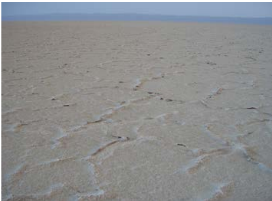
FIGURA 1. O imenso Chott El Djerid: crostas hexagonais de sais que resultam de períodos de dessecação.

Entre os vários lagos salgados que abundam na região sobressai, desde logo pela sua dimensão, o Chott El Djerid. Um dos maiores do mundo! Uma imensidão de sais a perder de vista, qual bela miragem, pois é mesmo de água que falamos. Com importante recarga de água dos maciços rochosos circundantes, algumas áreas da superfície do lago são recobertas por crostas de sais, formando largas estruturas poligonais que resultam de fenómenos de dessecação e que se desenvolvem em períodos de maior estiagem (FIGURA 1) 2 . É neste tipo de contexto sedimentar que ocorrem as famosas e genuínas rosas do deserto, cristais de gesso combinados com areia em forma de pétala de flor, com as suas cores tipicamente "terrosas". A imaginação dos nativos, à semelhança do que acontece com outras espécies minerais do Atlas marroquino, dá-lhes o colorido garrido, completamente artificial, que falta à paisagem (FIGURA 2). É a originalidade do povo norte africano no seu melhor.