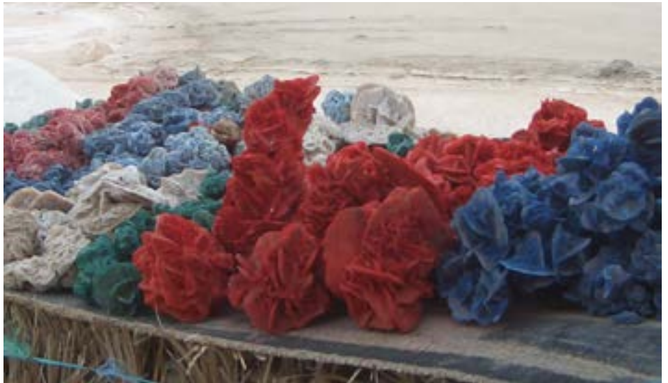
FIGURA 2. Rosas do deserto, contituídas por gesso (sulfato de cálcio hidratado) e areia, com "cores" para todos os gostos! Ótima imaginação.

Atravessando o Chott El Djerid em direção a Oeste, chega-se a Tamerza, conhecida pela sua antiga aldeia, quase fantasma, a testemunhar que, quando chove de verdade, os efeitos podem ser catastróficos. É nas imediações desta povoação que é conhecido o "grande" canyon da Tunísia, mas incomparavelmente menor do que o americano. Aqui, nas gorges de Tamerza, onde se contam algumas pequenas cascatas (FIGURA 3), as semelhanças são imensas com algumas das passagens do Paciente Inglês . A geologia é materializada por rochas sedimentares muito variadas, em camadas sub-horizontais, com forte continuidade lateral, cuja idade mais antiga remonta ao Cretácico Superior 3 . Entre elas, destacam-se umas rochas mais esbranquiçadas, os fosfatos, que dão nome a algumas minas da região. Mas, nesta ambiência árida, que já foi mar – o conhecido Tétis –, não falta novamente a paleta de cores, não só através das já expectáveis rosas do deserto pintadas como dos turbantes que se alinham no horizonte numa das zonas mais comerciais deste recanto geomorfológico da Tunísia.