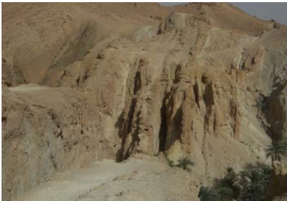
FIGURA 4. Rochas sedimentares estratificadas sub-verticais (Paleogénico) a montante do oásis de Chebika.

Muita e generosa geologia! Acompanhada, aqui e ali, pelos sons de batuque, por encantadores de serpentes ou por vendedores de qualquer coisa. À hora da refeição, o indispensável cuscuz. Que é garantido. Ao fim da tarde, um thé à la menthe . Para nos fazer recordar o Chá do Deserto de Bertolucci, rodado em Ouarzazate, no lado mais oriental do Atlas e do Saara. Um ótimo motivo para uma das próximas incursões por outros lugares deste lado único do planeta Terra.