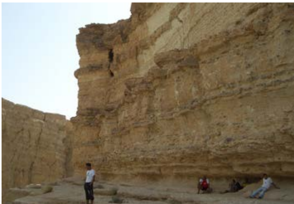
FIGURA 3. As "paredes" da Grande Cascata de Tamerza. Rochas sedimentares estratificadas sub-horizontais datadas do Paleogénico.

No conjunto de geossítios de Tozeur selecionados, fica a faltar Chebika, que combina um pouco de tudo o que atrás foi narrado. A pouco menos de meia-dúzia de quilómetros de Tamerza, Chebika parece testemunhar melhor o confronto dos relevos do Sul do Atlas com a plataforma saariana. Na paisagem sobressaem estratos de rochas do Terciário (Paleogénico) 4 , não muito diferentes dos de Tamerza, mas aqui em posição vertical, denunciando que as forças tectónicas, orogénicas, não foram nada, mesmo nada leves (FIGURA 4). Afinal, o Atlas é exemplo e produto das forças compressivas mais marcantes do globo. A cortar estas estruturas, desenha-se um estreito riacho, inclinado e particularmente encaixado, com as sedutoras quedas de água, fatalmente refrescantes, pois o clima, por aqui, é bem ardente. Devido à constante humidade do solo, desenvolve-se um oásis luxuriante, igualmente estreito porque a morfologia não dá para mais. Mas o curso de água não vai longe. Morre, precisamente, na sua parte mais aplanada, quando atinge o lago salgado mais próximo.