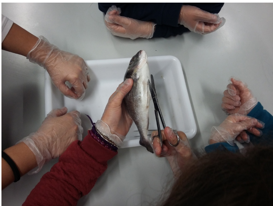
FIGURA 1. Alunos a iniciar a dissecação de uma Dourada ( Sparus aurata ) no decorrer da atividade “Biólogo por um dia”.

No MARE – Centro de Ciências do Mar e do Ambiente, os investigadores envolvem-se em atividades educativas que aproximam a ciência da sociedade e contribuem para uma sociedade azul participativa. Em particular, e no âmbito do seu programa educativo “O MARE vai à escola”, desenvolvem a atividade “Biólogo por um dia” em que os alunos são convidados a realizar uma sessão de amostragem biológica de peixe. Com recurso a apenas alguns peixes é possível desenvolver uma aula diferente, interativa e estimulante que aborda vários temas desde a biodiversidade marinha à anatomia, passando pela pesca e respetiva sustentabilidade, não descurando a importância da investigação para a sociedade.