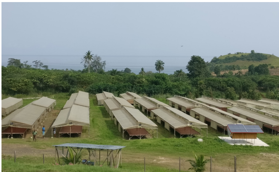
FIGURA 1. Localização futura da estação meteorológica, junto aos secadores solares de cacau, em Morro Peixe – Lobata, na sede da empresa SATOCAO.

A procura de uma fonte de rendimento para o agregado familiar cria uma pressão sobre a exploração de recursos naturais, que não tem em conta a proteção ambiental e a criação de práticas sustentáveis. Um exemplo desta realidade é a desflorestação no distrito de Lobata, motivada pela produção de carvão como fonte de rendimento para o agregado familiar. A produção de carvão artesanal leva ao abate indiscriminado de árvores num distrito caracterizado por ser uma zona de savana, o que leva a erosão dos solos ou perda de biodiversidade. A proposta de atuação passa pela recolha de dados meteorológicos (temperatura, precipitação, irradiação solar, entre outros) através de uma estação meteorológica construída pelos alunos, com base numa plataforma Arduino, para averiguar os impactos da desflorestação na área geográfica escolhida e proceder à informação e sensibilização do poder local e da população com a introdução de fornos solares em substituição do carvão. A promoção da utilização dos fornos solares junto da comunidade será feita através da divulgação do seu modo de funcionamento junto dos alunos da escola de Morro Peixe.