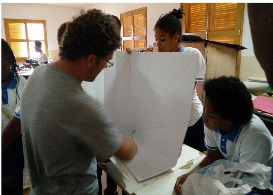
FIGURA 2. Construção de fornos solares.

diversos sensores. Esta atividade envolveu a interligação de conhecimentos de Física e de Programação, atualmente em ARDUINO WEB EDITOR. Esta tarefa revelou-se a parte mais técnica do projeto e a que consumiu e irá continuar a consumir mais tempo, tendo em conta a insularidade de São Tomé e Príncipe e os desafios técnicos que apresenta. Os alunos do 9º ano ficaram responsáveis pela construção dos fornos solares.