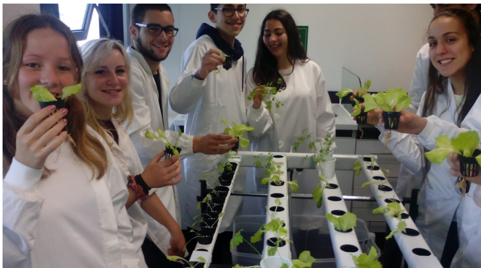
FIGURA 1. Técnica de Hidroponia.

Este sistema de cultivo permitiu trabalhar diferentes conteúdos relativos à electricidade, hidrostática e caudal volumétrico em Física; nutrição mineral das plantas, anatomia e fisiologia vegetal em Biologia. Na disciplina de Química foram trabalhados os seguintes temas: funções químicas, soluções, equilíbrio químico, condutividade elétrica e densidade da solução nutritiva, concentração e pH.