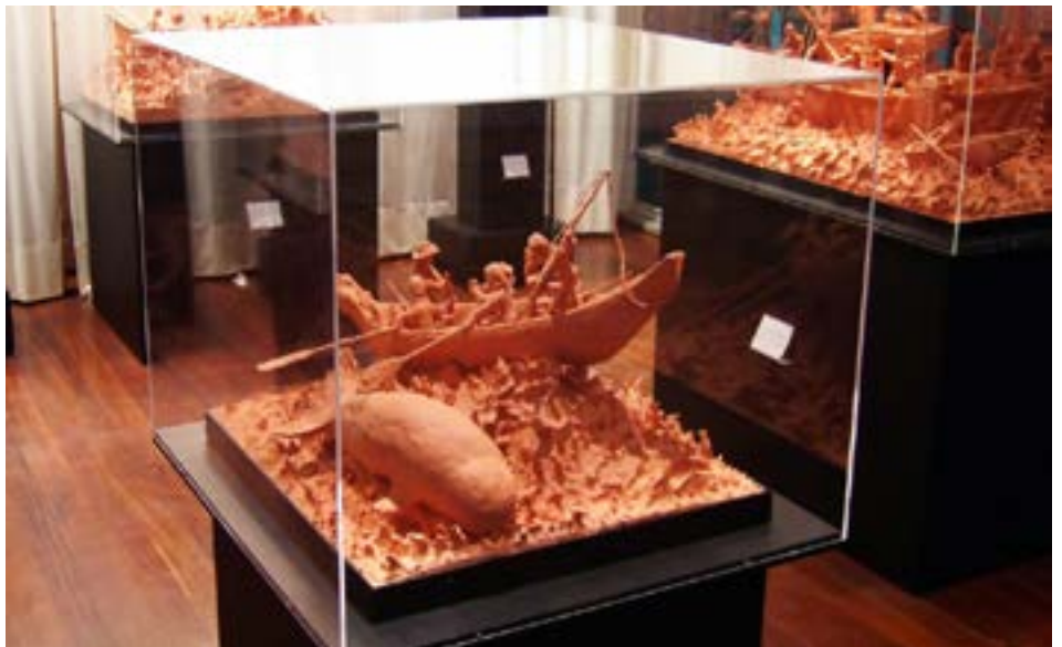
FIGURA 4. Exposição permanente "Pesculturas".