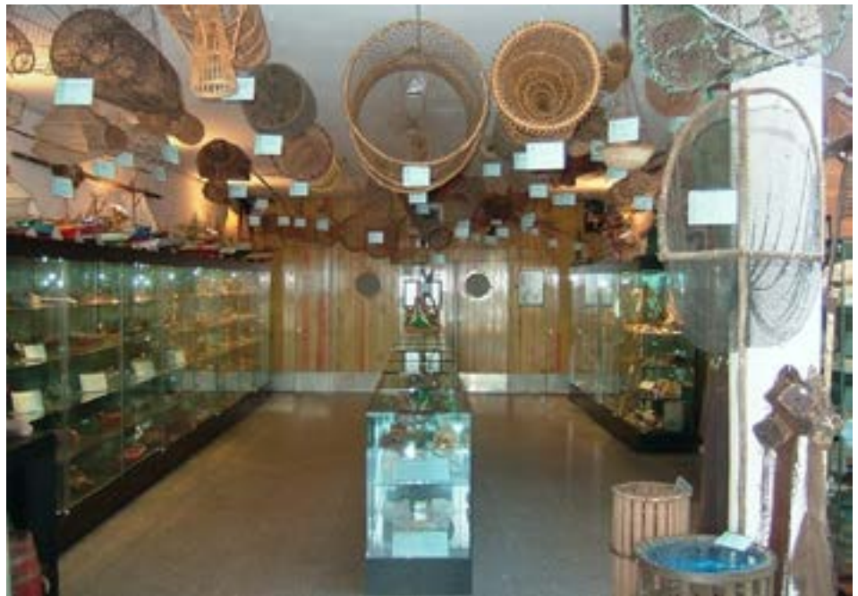
FIGURA 2. Museu das Pescas, vista geral.

Horário de visitas: todos os dias das 10h às 18h (exceto 25 de dezembro).