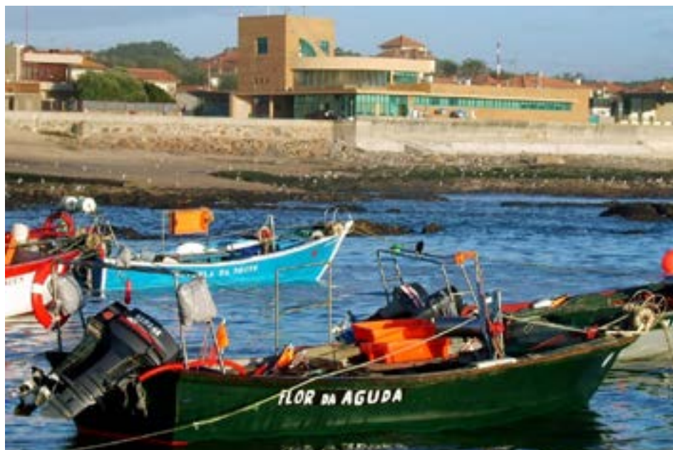
FIGURA 1. Estação Litoral da Aguda vista a partir do mar.

A Estação Litoral da Aguda - ELA (FIGURA 1), localizada na praia da Aguda, no Concelho de Vila Nova de Gaia, integra um Museu das Pescas (FIGURA 2), um Aquário (FIGURA 3) e um Departamento de Educação e Investigação. Pertence à Câmara Municipal de Gaia e é gerida pela empresa municipal Águas de Gaia E.M., S.A.. Abriu ao público em Julho de 1999 tendo recebido, até agora, 380.000 visitantes.