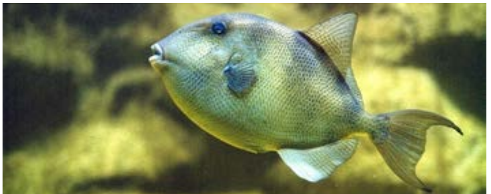
FIGURA 5. Peixe-porco Balistes carolinensis .