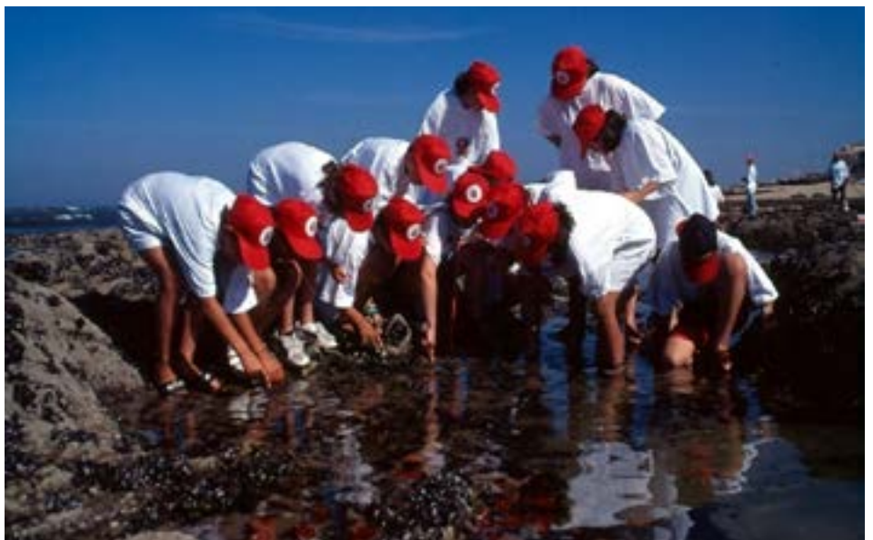
FIGURA 7. Sessão do Programa de Educação Ambiental no Litoral.