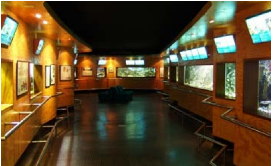
FIGURA 3. Aquário, vista geral.