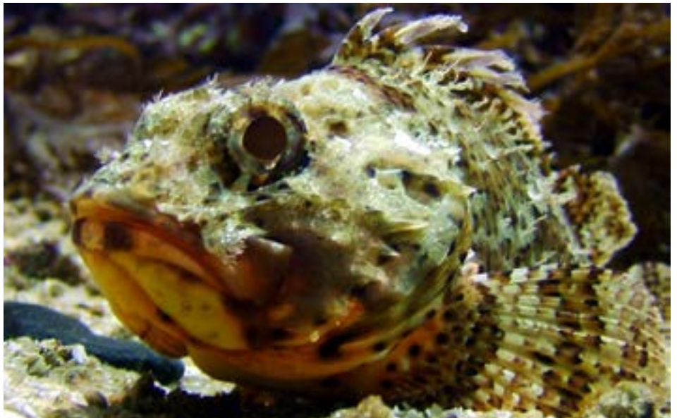
FIGURA 6. Rascasso Scorpaena scrofa ..