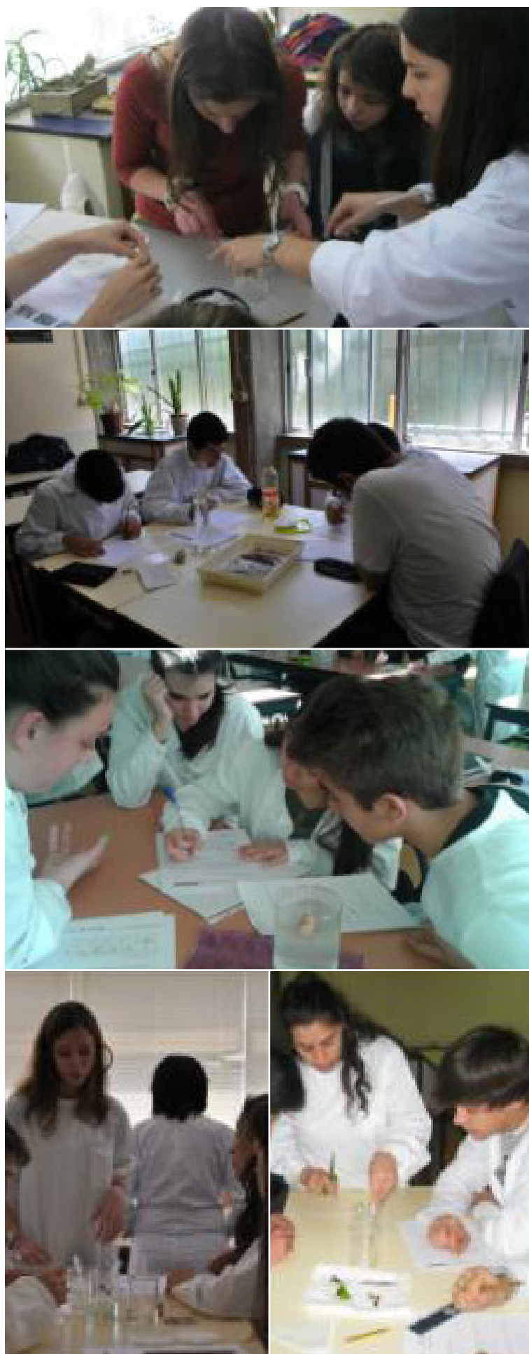
Figura 1 Atividades do “CIIMAR na Escola” a serem realizadas por alunos na sala de aula.

urbanas, agrícolas e industriais entram nestes sistemas. Muitas das substâncias químicas que têm sido detetadas nos ecossistemas costeiros e marinhos fazem parte de produtos que utilizamos regularmente no nosso dia-a-dia (e.g., detergentes, medicamentos, produtos de higiene pessoal).