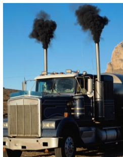
Figura 1. A combustão incompleta do diesel provoca a libertação de fuligem. (Extraído de 3)

Uma combustão é uma reação química em que uma substância reage com dióxigénio, resultando, geralmente, libertação de calor e emissão de radiação. Numa combustão, a substância combustível reage com a substância comburente originando diversos produtos de combustão.