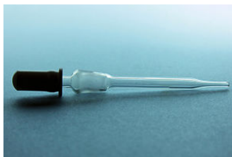
FIGURA 1. Conta-gotas.

Um conta-gotas (ver figura 1) é um instrumento bastante utilizado em laboratório para transferência de pequenos volumes de substâncias no estado líquido.