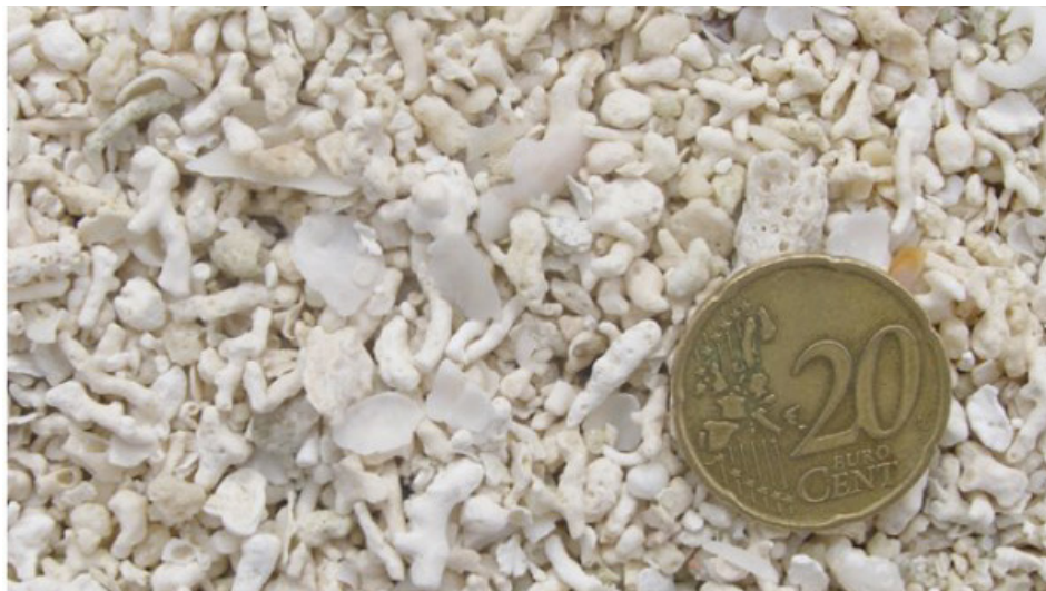
FIGURA 4. Acumulação recente de praia de fragmentos bioclásticos, resultantes do desmantelamento do recife de coral em épocas de tempestade.

No que concerne à morfologia destas ilhas, é fácil perceber que a sua história geológica é muito recente, remontando já à parte superior do Holocénico. Segundo estudos dos últimos anos 2 , estas ilhas terão sido formadas há pouco mais de 4,5 mil anos, através dum empilhamento de sedimentos calciclásticos, normalmente de origem bioclástica, que se sobrepõem a sedimentos finos de origem lagunar ou de antigos aparelhos recifais (coralíferos). De tal forma que, se os nossos antepassados portugueses do século XVI, dados à conquista de novos territórios — e que terão governado momentaneamente as Maurícias —, tivessem navegado por estas paragens 5 mil anos antes da verdadeira descoberta, não teriam vislumbrado nenhum sinal de “terra à vista”. No máximo, podiam era ter encalhado, dada a forte proliferação de recifes de coral então existentes a pouquíssima profundidade. Basta olhar para a configuração e movimentação das placas litosféricas oceânicas do Índico, para entender que nesta área do globo terá decorrido uma deposição carbonatada marinha ao longo de algumas dezenas de milhões de anos 3 , que se terá sobreposto às rochas vulcânicas, que tanto caracterizam o fundo marinho, assim como o substrato e a morfologia de algumas das restantes ilhas do Índico, como são os casos da Reunião, Rodrigues e Maurícia.