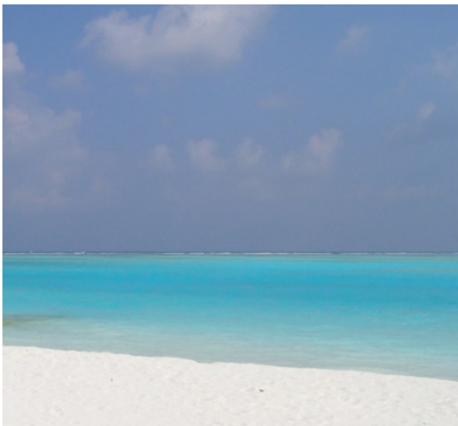
FIGURA 2. Contraste entre o branco da areia (carbonatada) da praia e o azul turquesa da laguna. Ao fundo, o limite do atol. Uma imagem de marca das Maldivas.

Tudo isto, e muito mais, recorda-nos uma série de documentários sobre o impacto das alterações climáticas. Desde Uma Verdade Inconveniente de 2006, do ex vice- Presidente dos EUA, Al Gore, ao recentíssimo e mais atual Before the Flood , que tem Leonardo DiCaprio como narrador, já que os grandes protagonistas deste documentário são, inevitavelmente, o homem e a Terra! E, num impulso, até poderíamos recordar o malfadado Titanic , e do provável maior número de icebergues que aquele encontraria nos dias de hoje nos mares do Atlântico Norte. Mas é o menos conhecido The Island President , de Mohamed Nasheed, o então presidente das Maldivas, que nos conduz a um dos lugares que representa maior risco no planeta, quanto à iminente subida do nível do mar, resultante do aumento vertiginoso dos gases de efeito de estufa: as Maldivas. Situado no maravilhoso Oceano Índico, este país é só, morfologicamente falando, o mais raso do Mundo! E um dos mais atrativos pelas suas centenas de ilhas de cor branca, num contraste com os múltiplos tons de azul e verde da água do mar, imagem capaz de instigar a ambição de quem anseia encontrar o paraíso.