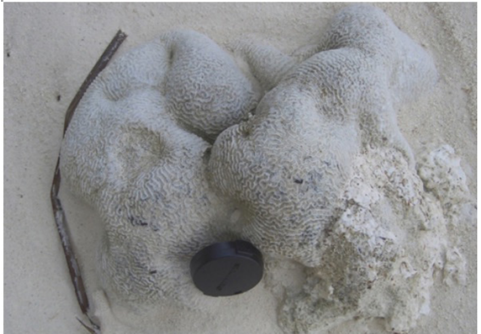
FIGURA 3. Corais hermatípicos na ilha de Meeru. Uma prova de que o nível do mar esteve mais alto em épocas pretéritas recentes.

de atóis. A fazer-nos lembrar a célebre teoria de Charles Darwin sobre a gênese deste tipo de morfologias marinhas, quando ele e o Beagle navegavam por águas do Pacífico. No caso das Maldivas, sem qualquer vestígio de rochas vulcânicas à superfície da água do mar. Uma paisagem que seria a esperada em pleno oceano, onde se forma basalto e rocha afim, como é o caso, por exemplo, de uma sua grande “concorrente” turística, a Bora-Bora, na Polinésia Francesa. Uma comparação que nos permite perceber toda a teoria de Darwin quanto à gênese de um atol.