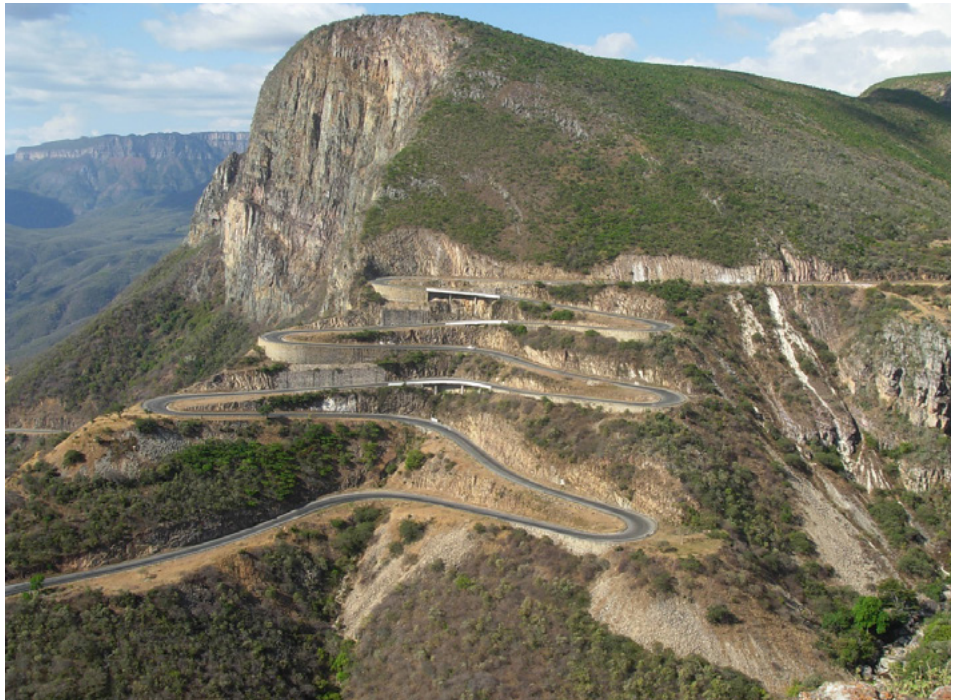
FIGURA 1. A imagem clássica do miradouro da Serra da Leba, conjugando aspetos da geomorfologia com a famosa "Estrada da Leba".

Entre toda a sucessão sedimentar, predominantemente siliciclástica e com algumas intercalações vulcanoclásticas ácidas (rochas ígneas onde predomina a sílica, o sódio e o potássio) 3 , sobressai a Formação da Leba de natureza carbonatada e que tem um dos seus melhores registos exatamente na Serra com o mesmo nome. Esta unidade é composta essencialmente por estratos dolomíticos, dada a abundância de um mineral de carbonato de cálcio e magnésio, a que se sobrepõe forte silicificação (FIGURA 2). A dolomite, que é um "quebra-cabeças" para o sedimentólogo, dada a sua raridade nos ambientes sedimentares atuais, contrastando com a sua grande abundância no registo geológico antigo. Como é o caso, por exemplo, da Formação de Coimbra, da base do Jurássico português, de onde provém a rocha (dolomia ou dolomito) que edifica a Sé Velha e grande parte da Igreja de Santa Cruz, vultos arquitetónicos da cidade de Coimbra. Na Serra da Leba, apesar da pequena expressão métrica, o conjunto rochoso carbonatado do Neoproterozoico mostra diversos processos de carsificação subterrâneos (grutas, com claros sinais de ocupação humana primitiva) e superficiais, fenómenos típicos destas litologias. Embora esteja a algumas centenas de metros da escarpa que melhor caracteriza os contornos do Planalto da Humpata, é notório o registo desta unidade na paisagem, facilmente identificada pela vegetação espinhosa que a individualiza, cujas raízes se prolongam por profundas fraturas.