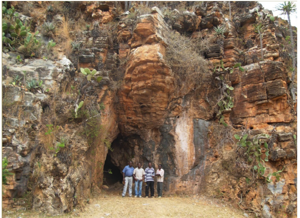
FIGURA 2. Gruta na Serra da Leba em rochas dolomíticas silicificadas com forte laminação de origem microbiana (Formação da Leba). De notar a vegetação espinhosa tão característica desta unidade carbonatada.”

Mas, entre todo este gigantesco enquadramento mesoscópico, é à escala macro e microscópica que se evidencia, numa perspetiva mais global, a geologia sedimentar da Formação da Leba. Tudo, “por culpa” da ocorrência de magníficas estruturas estromatolíticas (FIGURAS 3 E 4), testemunhos de atividade microbiana que terão dominado os ambientes marinhos proterozoicos, muito antes de se assistir à grande “explosão” da vida na Terra, a que marca o início do Fanerozoico. Com estromatólitos para diversos gostos, considerando as diferentes morfologias e aspetos diagenéticos fossilizados, estes corpos sedimentares são acompanhados de marcas de ondulação e por outros registos de um ambiente marinho muito superficial (oncólitos e oólitos), fazendo lembrar — com as devidas diferenças — , através do incontornável Princípio do Uniformitarismo, a célebre Baía dos Tubarões, na Austrália Ocidental: o “paraíso” dos estromatólitos atuais. Não fosse este, um dos Princípios da Geologia que melhor permite ao geólogo entender o passado a partir da observação e interpretação dos sistemas sedimentares atuais.