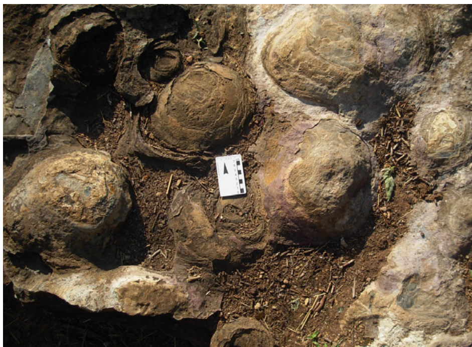
FIGURA 3. Cúpulas estromatolíticas muito bem preservadas em sedimentos de natureza dolomítica (Formação da Leba, Planalto da Humpata).