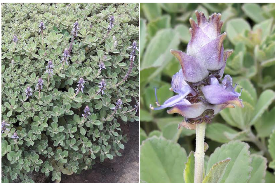
FIGURA 1. Boldo Mirim florindo em Teresópolis (à esquerda); detalhe da inflorescência (à direita).

Os óleos essenciais são misturas complexas, constituídas por diversas substâncias que conferem o aroma ao Boldo Mirim e a outras plantas.