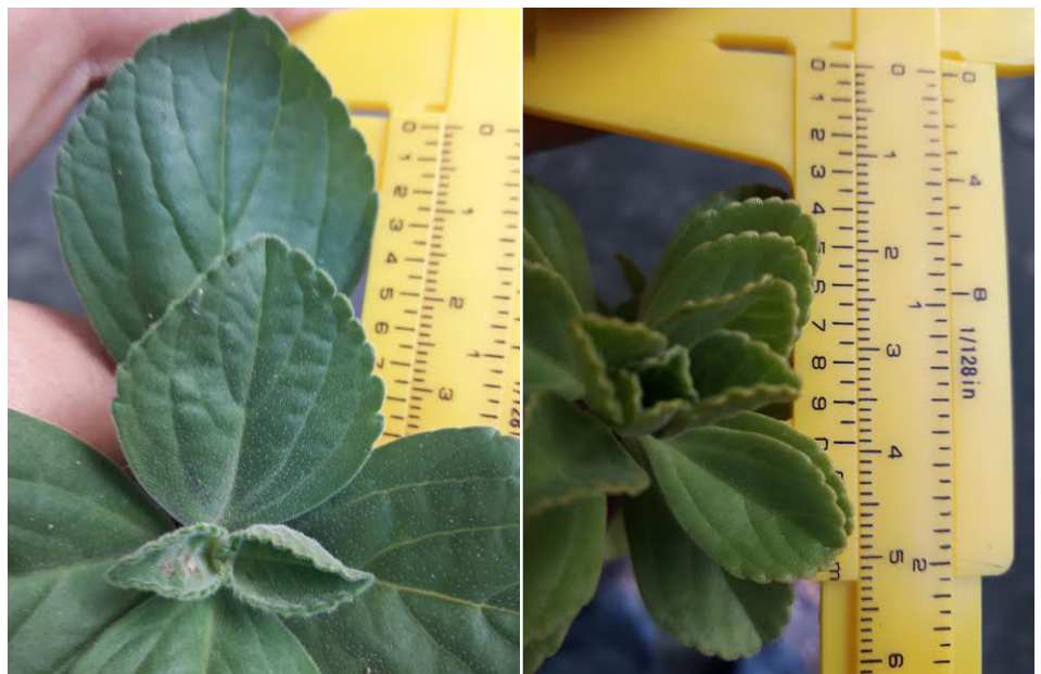
FIGURA 3. Detalhes dos ápices de ramos de Boldo Mirim cultivado na área de sombra (à esquerda) e área ensolarada (à direita) em Niterói, tendo como referência um paquímetro graduado em centímetro.