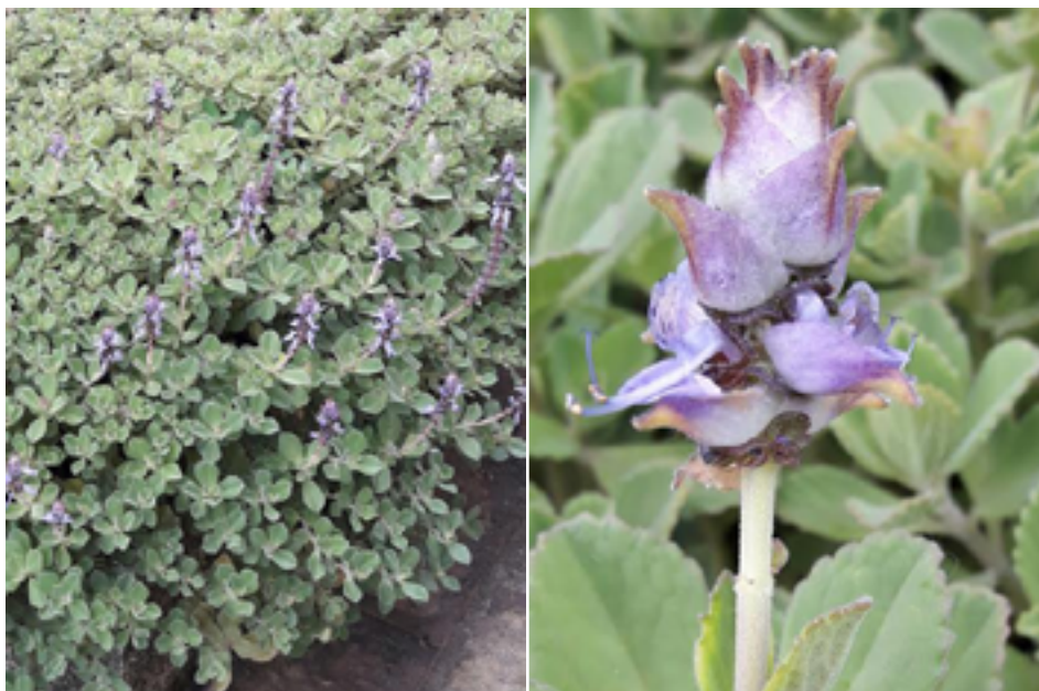
FIGURA 1. Boldo Mirim florindo em Teresópolis (à esquerda); detalhe da inflorescência (à direita).

Os óleos essenciais são misturas complexas, constituídas por diversas substâncias que conferem o aroma ao Boldo Mirim e a outras plantas.