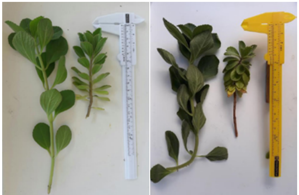
FIGURA 2. Ramos do Boldo Mirim colhidos na área de sombra (esquerda) e área ensolarada (direita) em Teresópolis (à esquerda) e em Niterói (à direita), tendo como referência um paquímetro de 20 cm de comprimento.

Em termos somáticos, observamos que: (i) o número de folhas por ramo; (ii) distância entrenós (distância entre as folhas ao longo dos ramos); (iii) área foliar média, foram diferentes tanto entre as condições de insolação como também em relação às condições geográficas e climáticas das cidades envolvidas (Teresópolis e Niterói), como está demonstrado nas fotos das Figuras 2 e 3 e representado numericamente na Tabela 1.