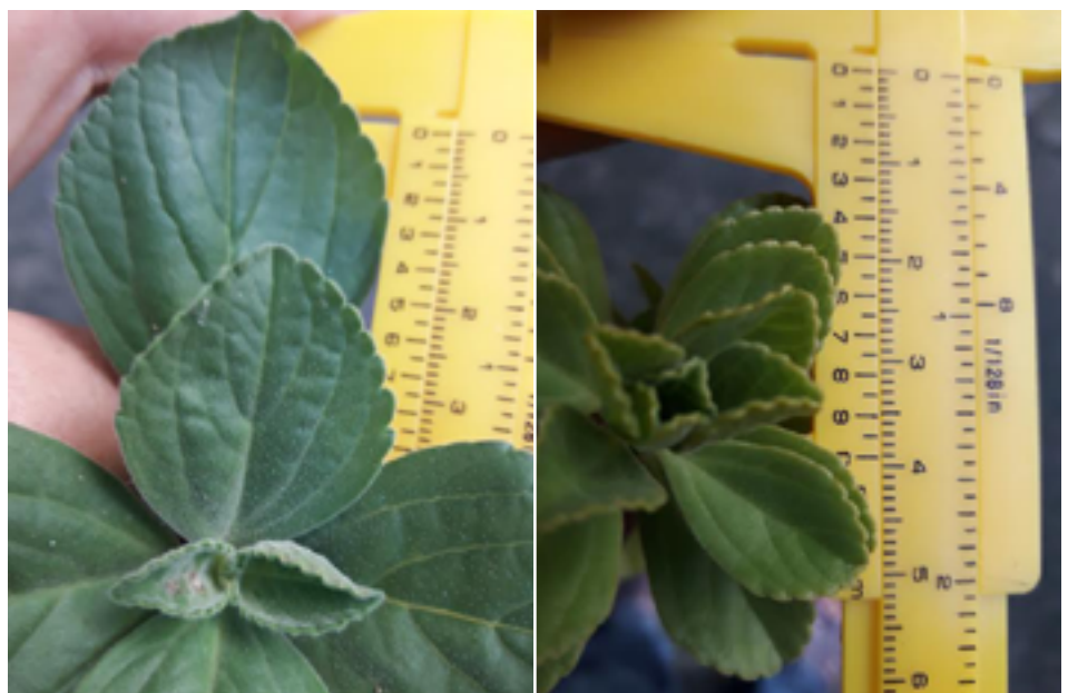
FIGURA 3. Detalhes dos ápices de ramos de Boldo Mirim cultivado na área de sombra (à esquerda) e área ensolarada (à direita) em Niterói, tendo como referência um paquímetro graduado em centímetro.