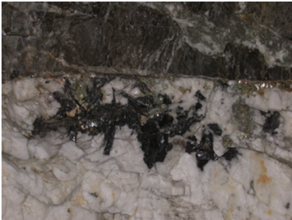
FIGURA 1. Filão do jazigo de volfrâmio da Panasqueira. Parte do filão em que pode ver-se quartzo (mineral branco), wolframite (mineral preto), moscovite (mineral prateado brilhante) e pirite (mineral amarelado). Só a wolframite é o mineral rico em W.

resenta, assim, uma concentração geoquímica anômala, em referência ao teor médio da crosta ou “clarke” que, por exemplo, para o ferro é 58000ppm (5,8%), 1ppm para o volfrâmio e 2ppb (0,002 ppm) para o ouro.