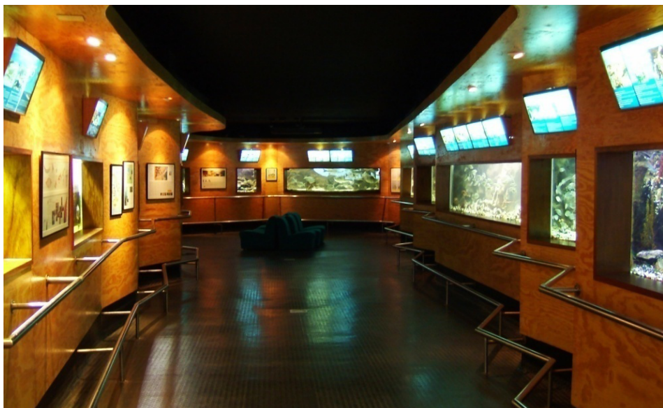
FIGURA 3. Aquário, vista geral.