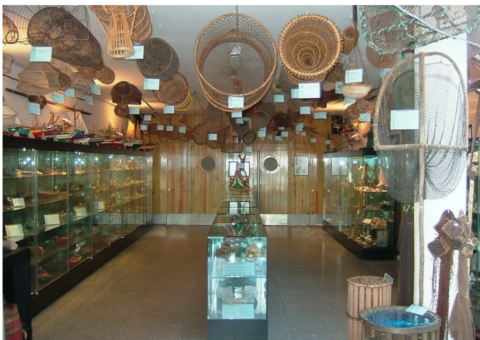
FIGURA 2. Museu das Pescas, vista geral.

Horário de visitas: todos os dias das 10h às 18h (exceto 25 de dezembro).