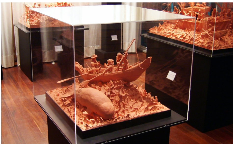
FIGURA 4. Exposição permanente "Pesculturas".