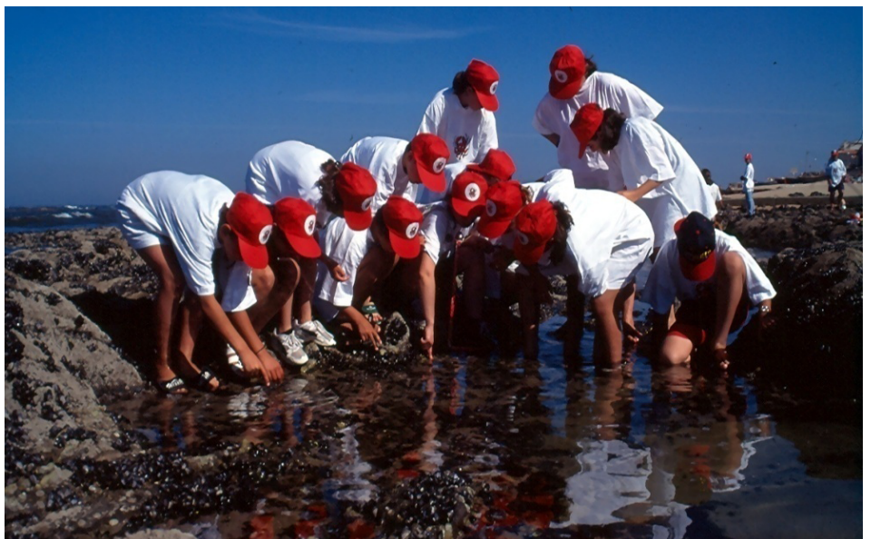
FIGURA 7. Sessão do Programa de Educação Ambiental no Litoral.