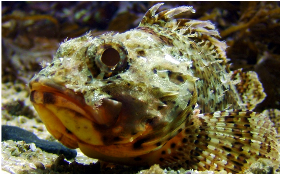
FIGURA 6. Rascasso Scorpaena scrofa ..