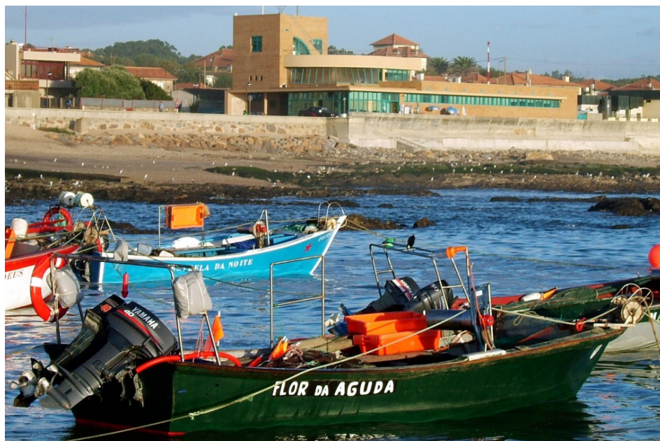
FIGURA 1. Estação Litoral da Aguda vista a partir do mar.

A Estação Litoral da Aguda - ELA (FIGURA 1), localizada na praia da Aguda, no Concelho de Vila Nova de Gaia, integra um Museu das Pescas (FIGURA 2), um Aquário (FIGURA 3) e um Departamento de Educação e Investigação. Pertence à Câmara Municipal de Gaia e é gerida pela empresa municipal Águas de Gaia E.M., S.A.. Abriu ao público em Julho de 1999 tendo recebido, até agora, 380.000 visitantes.