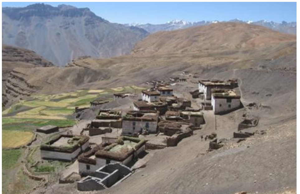
FIGURA 3. Aldeia nos Himalaias, Índia