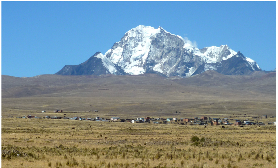
FIGURA 2. Pré-cordilheira andina, Bolívia.

Naturalmente o peso relativo destes diversos fatores foi variando ao longo do tempo, a par da própria evolução das comunidades e das suas atividades. Consoante a importância relativa das questões defensivas ou agrícolas, assim as localizações terão privilegiado posições mais altaneiras ou nas planuras, por exemplo. E frequentemente constatamos também como, ao longo dos séculos, uma mesma aldeia, vila ou cidade se expandiu ou transferiu (gradual ou repentinamente) para uma outra localização, na busca de uma maior proximidade a algum recurso natural que se lhe tornou entretanto mais importante ou mesmo indispensável.