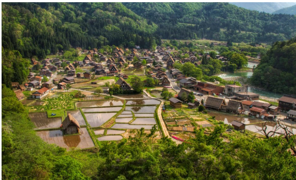
FIGURA 1. Aldeia de Shirakawa-go, Japão.

sejam animais ou vegetais, desde sempre recorreu a instrumentos líticos (e mais tarde metálicos), desde a sua colheita ou caça, até à sua transformação em comida para todos. Não admira por isso a localização de numerosas comunidades pré-históricas em áreas onde o sílex, o quartzito ou outra litologia igualmente favorável, se encontra disponível em abundância.