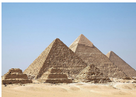
FIGURA 1. O complexo de pirâmides de Gizé, Egito.

Usando uma tecnologia usualmente reservada para a física de partículas, foi possível encontrar uma cavidade na grande pirâmide de Gizé. É a primeira grande descoberta estrutural desde o século XIX. Este novo espaço pode incluir uma ou mais salas e corredores porque os registos dão uma imagem muito grosseira do espaço vazio.