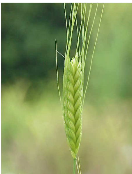
FIGURA 1. Espécie de trigo ( Triticum monococcum ) originário do Médio Oriente.

As plantas selvagens têm uma tendência genética para espalhar as sementes. Quando as sementes passam a ser recolhidas, armazenadas e semeadas, a evolução é alterada passando a ser preferida a retenção das sementes. A reprodução da planta fica então dependente da intervenção humana.