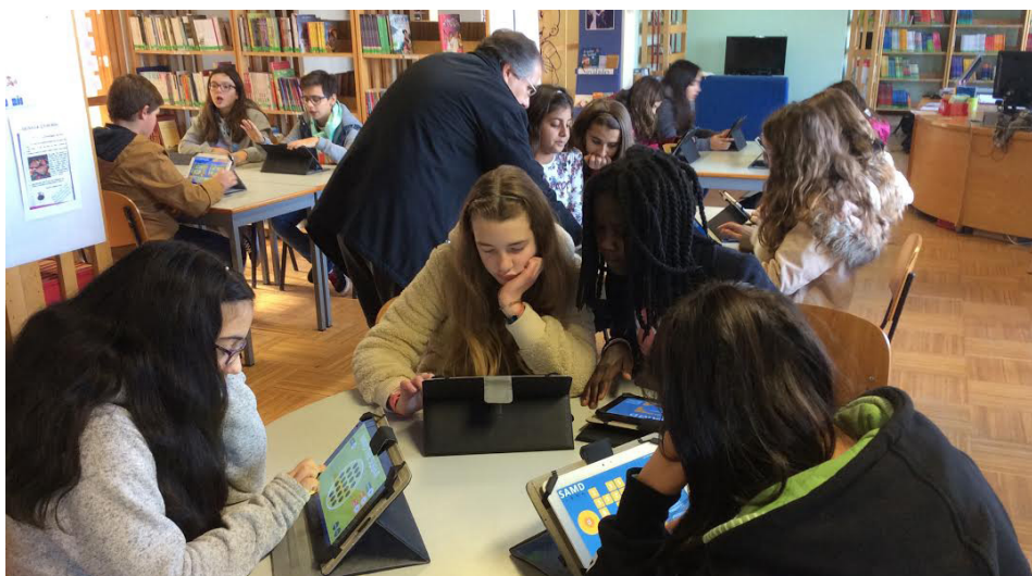
FIGURA 1. Trabalho de cálculo mental com recurso às aplicações/jogos do Hypatiamat instaladas nos tablets.

As aulas decorrem de acordo com um roteiro (RED disponibilizado no portal da Casa das Ciências), elaborado pelos diversos intervenientes no projeto. O roteiro está programado para aulas de 45' e centra-se num jogo – SAMD – que contempla as quatro operações aritméticas. Para poderem aceder ao jogo, os alunos fazem login e todo o seu desempenho fica registado para posterior consulta por parte do professor. Desta forma, o professor pode monitorizar, continuamente, o aproveitamento do aluno. Esta monitorização é feita através do escritório virtual do professor, alojado na plataforma Hypatiamat. Aqui, o professor tem acesso ao número de jogos que o aluno realiza em cada sessão, à pontuação obtida, à pontuação máxima e mínima, à média obtida quer individual quer coletivamente, entre outros dados.