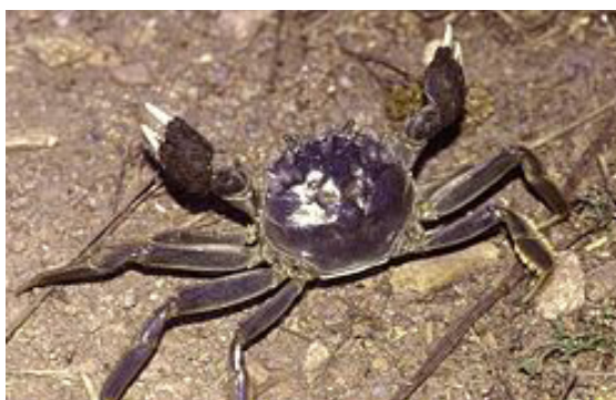
FIGURA 1. Caranguejo-peludo-chinês

O caranguejo-peludo-chinês possui cor acastanhada e a sua carapaça pode atingir 5 centímetros de comprimento. Uma característica de identificação importante desta espécie é a “luva de pele” que possui nas garras (FIGURA 1). Este caranguejo é um predador omnívoro e a sua dieta inclui uma vasta gama de plantas, invertebrados, peixes e detritos, sendo os gastrópodes e os bivalves a componente alimentar dominante deste animal 1 .