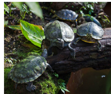
FIGURA 1. Tartaruga-da-Flórida

Curiosidade: a tartaruga-da-Flórida é dos répteis mais vendidos no mundo 1 .