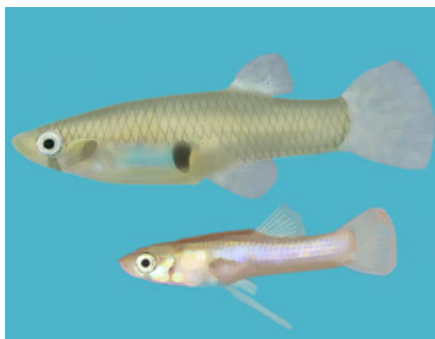
FIGURA 1. Fêmea e macho de gambúsia

O gambúsia é um peixe de pequenas dimensões 1 (os machos atingem 30 milímetros de comprimento e as fêmeas 60 milímetros), cinzento e com pequenos pontos no corpo e barbatanas. Possui uma mancha escura que atravessa o olho na vertical e barbatanas incolores ou amareladas. As fêmeas possuem ventre proeminente e são maiores do que os machos. Estes apresentam os raios da barbatana anal mais alongados, transformando esta barbatana num órgão copulador 2 (FIGURA 1).