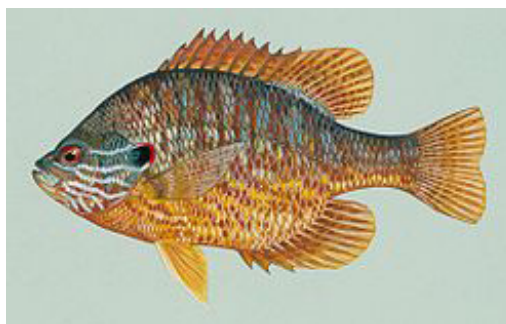
FIGURA 1. Perca-sol

A perca-sol é uma espécie de dimensões relativamente pequenas 1 (até 15 centímetros). Possui corpo comprimido lateralmente com uma coloração muito vistosa (manchas azuis que irradiam da cabeça até aos flancos, uma mancha negra e vermelha no extremo posterior dos opérculos e ventre amarelado) 3 . A barbatana dorsal é grande e possui duas partes, a primeira destas com raios espinhosos 2 (FIGURA 1).