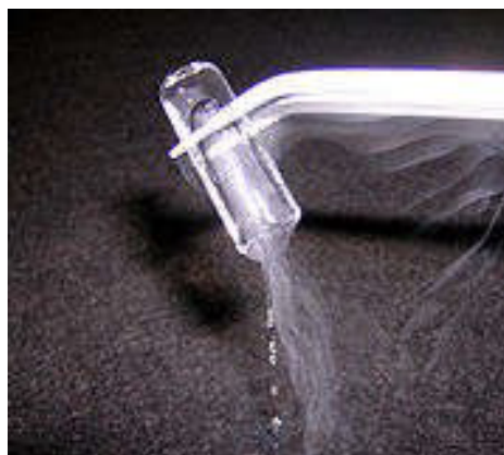
FIGURA 2. As três fases do néon estão bem visíveis no pequeno pedaço de gelo de néon em fusão rápida.

Fluidos em movimento apresentam viscosidade, uma forma de atrito interno. (A exceção é o hélio superfluido). Se aplicarmos uma tensão tangencial a um sólido, ele deforma-se até atingir novo equilíbrio. Num líquido, porém, uma tensão tangencial origina escoamento, sendo válida, para muitos fluidos, a equação postulada por Newton: