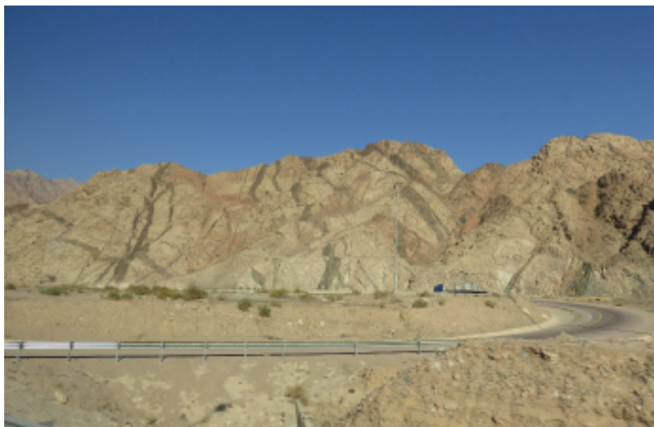
FIGURA 4. Rochas granitoides do Complexo de Aqaba densamente recortadas por filões de rocha básica. Estrada nº 80, perto de Aqaba.

granitoides, proterozoicas, do Complexo de Aqaba, o tal que aflora na base rochosa de Wadi Rum, encontram-se intensamente recortadas por diques magmáticos de diversas composições mineralógicas e geoquímicas 2 (FIGURA 4). Apesar de ser extremamente fácil identificar algumas das múltiplas paisagens de Wadi Rum (inselbergues, dunas, estratos erodidos, etc...) no Lawrence da Arábia de David Lean, o mesmo não acontece com a passagem cinematográfica da chegada - e consequente conquista aos turcos - a Aqaba. As pretensas montanhas de Aqaba estão lá, no filme, mas falta a espetacularidade dos diques magmáticos. Certamente, um dos melhores "livros" abertos, com este tipo de corpos de natureza ígnea.