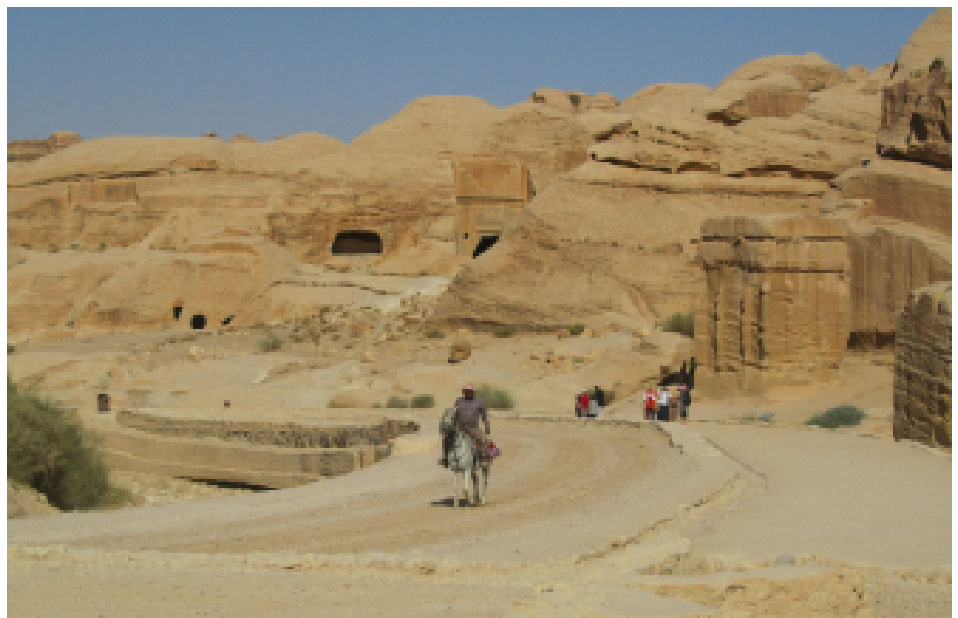
FIGURA 3. Corpos sedimentares da unidade Disi Sandstone (uma das formações do Grupo Ram que mostra a transição do Câmbrio ao Ordovício) aflorante em Petra, nas imediações do Túmulo do Obelisco. Entre as diversas esculturas exibidas em arenitos de cor cinzenta-esbranquiçada abundam estruturas entrecruzadas, resultantes de ação fluvial ao tempo da sua génese.

Tendo sempre por base o princípio do Uniformitarismo, neste ciclo, o Mar Vermelho exemplifica precisamente a fase embrionária de um oceano (a “Fase Mar Vermelho”), com direito a rifte médio oceânico, de natureza basáltica. Uma história complexa de atividade magmática recorrente e diferenciada 4 e que separa hoje as placas arábica e africana. Neste contexto, o Golfo de Aqaba não é mais do que o efeito de uma falha transformante, prolongando-se para norte, pelo Mar Morto e pelo não menos bíblico vale do rio Jordão.