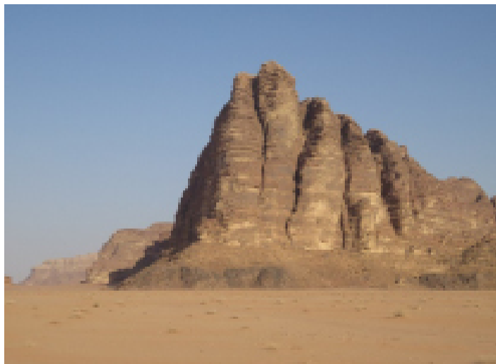
FIGURA 1. A imagem de entrada em Wadi Rum, a seguir ao Centro de Visitantes: as "seven pillars of wisdom". Onde se nota muito bem a inconformidade entre as rochas ígneas proterozoicas do Complexo de Aqaba (na base; aqui com uma cor escura intensa devido à ocorrência de rochas básicas) com rochas arenosas, estratificadas, do Paleozoico Inferior (Grupo Ram).

Distanciada cerca de 100 quilómetros de Wadi Rum, mas algo idêntica quanto ao seu contexto geológico, litológica e temporalmente falando, deparamo-nos com aquela que é considerada a segunda das novas Sete Maravilhas do Mundo: a cidade nabateia de Petra. Um hino à arte e arquitetura! Com afloramentos de arenitos e rochas afins, do Paleozoico Inferior, intensamente esculpidas no mais ínfimo pormenor estético, desde o desfiladeiro, estreito, longo e sinuoso (Siq), que conflui no símbolo mais globalizado de Petra, o Al-Khazneh ("tesouro") (FIGURA 2), até às múltiplas fachadas que compõem este sítio arqueológico, interminável e diverso, capaz de nos deixar completamente rendidos. O enquadramento ideal para Harrison Ford (o Indiana Jones) e o seu fictício pai, Sean Connery, protagonizarem a alucinante busca do Cálice Sagrado . Do ponto de vista geomorfológico, é particularmente interessante uma visão aérea deste espaço, que nos permite perceber melhor o lado escondido onde se instalou esta cidade e que se aproveitou dos intensos fenómenos de erosão ocorridos ao longo dos últimos milénios. Curiosamente, uma cidade instalada nas mesmas unidades que afloram em Wadi Rum. No caso, com arenitos mais quartzosos, com belíssimas estruturas entrecruzadas (FIGURA 3), a testemunharem uma continuidade da ação fluvial então reinante nesta porção do atual Médio Oriente, embora com maior influência marinha relativamente aos registos no "deserto vermelho" 3 .