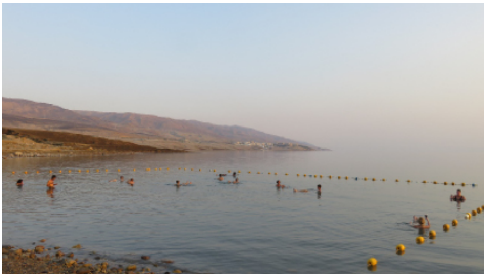
FIGURA 5. O Mar Morto na sua extremidade mais setentrional: a imagem clássica dos corpos humanos a flutuar numa massa de água com uma concentração de sais cerca de dez vezes superior à dos oceanos.

5). Um verdadeiro tesouro do outro mundo! Para vivenciar antes que possa desaparecer!