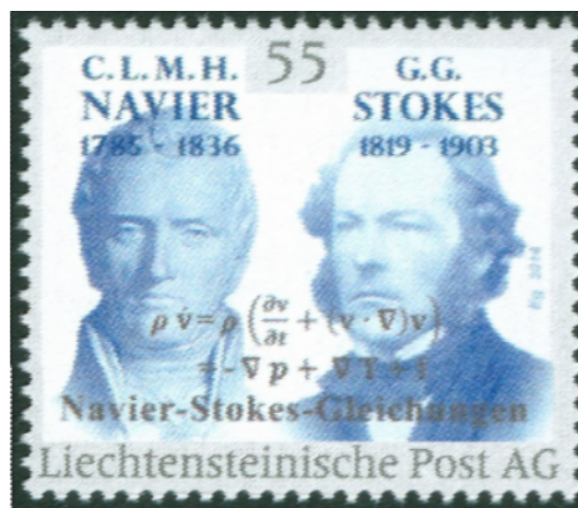
FIGURA 1. Evocação, em selo, de Charles Navier e George Stokes, e da equação que leva os seus nomes.

c) Em terceiro lugar, temos de considerar os campos de forças que atuam sobre o fluido. Desde logo, o peso que origina a densidade volúmica \rho \vec{g} , mas para várias situações, sobretudo em meteorologia ou geofísica, também a força de Coriolis 2 devida à rotação da Terra. O campo de pressões determina outra importante força: se a pequena massa está submetida a uma pressão não uniforme, surgirá uma força que aponta da maior para a menor pressão, i.e., oposta ao gradiente de pressões, originando a densidade volumica -\nabla p . Em fluidos viscosos há, também que incluir as tensões viscosas; no caso de fluidos newtonianos 3 e isotrópicos, a tensão é proporcional o gradiente da velocidade, daqui resultando a densidade volumica 4 \eta \Delta \vec{v} + \left( \frac{\eta}{3} + \zeta \right) \nabla(\nabla \cdot \vec{v}) onde \eta é o coeficiente de viscosidade dinâmica e \zeta é o coeficiente de viscosidade volúmica, ambos, aqui supostos constantes. Note-se que o último termo da expressão anterior, desaparece para fluidos incompressíveis; em qualquer caso, ele será ignorado no que se segue (tal termo, porque proporcional a um gradiente, pode ser adicionado ao termo de pressão, redefinindo, assim, este último campo).