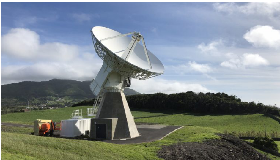
FIGURA 2. A estação VLBI RAEGE de Santa Maria, Açores.

A principal desvantagem da VLBI está relacionada com os custos de operação e manutenção, que tem conduzido à desativação de antenas em países como o Canadá e os EUA. Por outro lado, há países em que se investe nesta tecnologia, como é o caso de Portugal e Espanha, com o desenvolvimento do projeto RAEGE (Rede Atlântica de Estações Geodinâmicas e Espaciais). Com estações localizadas em 3 placas tectónicas distintas (na FIGURA 2, a estação VLBI de Santa Maria, Açores), as observações daquelas estações permitirão, por exemplo, ter um melhor conhecimento da geodinâmica nesta região.