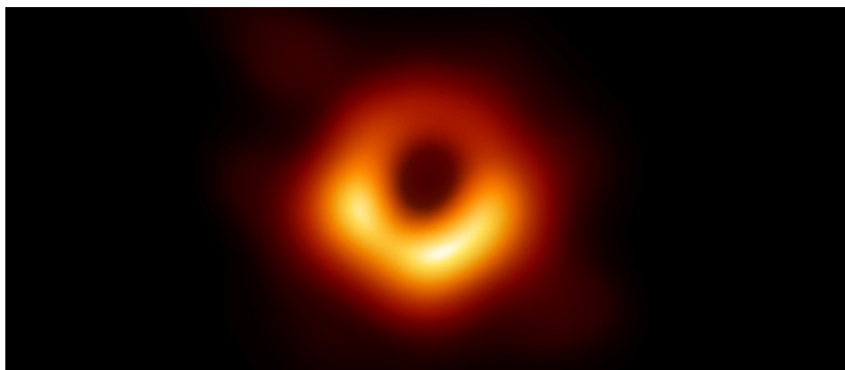
FIGURA 1. Primeira imagem da sombra de um buraco negro obtida pela colaboração Event Horizon Telescope 2 .

Na Teoria da Relatividade Geral existem singularidades inerentes à teoria, como foi demonstrado por Stephen Hawking e Roger Penrose (para uma exposição detalhada ver por exemplo, “ Large Scale Structure of Space Time ” escrito em colaboração com o físico sul-africano George Ellis, publicado em 1973 1 ). Uma dessas singularidades corresponde ao início do Universo – Big Bang –, outras apresentam-se nos buracos negros. Estes podem ser estelares, que advêm do colapso gravitacional de uma estrela com pelo menos três massas solares, ou galácticos, supostamente no centros das galáxias e muito particularmente daquelas com o núcleo central ativo, ou ainda serem objetos mais exóticos - os buracos negros primordiais, formados da matéria inicial do Universo. Apesar de serem bastante bizarros, os buracos negros podem existir em profusão no Universo. De facto, há inúmeros indícios de que a maioria das galáxias alberga no seu centro um buraco negro supermaciço, sendo que a primeira imagem de um objeto desta natureza com uma massa de 6,5 mil milhões vezes a do Sol, residente no centro da galáxia M87 a 55 milhões de anos-luz da Terra, foi obtida pelo projeto Event Horizon Telescope e divulgada no dia 10 de abril de 2019.