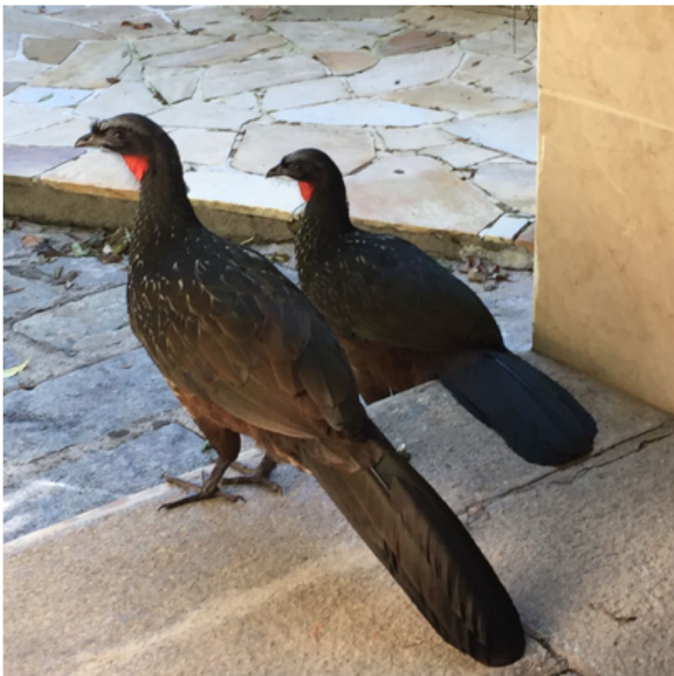
FIGURA 2. Fotos de exemplares macho (esquerda) e fêmea (direita) de jacu ( Penelope sp.), em uma residência na cidade de Petrópolis, estado do Rio de Janeiro, Brasil

Jacu é um pássaro do gênero Penelope que ocorre nas Américas, sendo indicativo de boa qualidade do ambiente. No Brasil, existem sete espécies de jacu e algumas eram domesticadas pelos índios devido a sua docilidade. Na região do estado do Rio de Janeiro esse pássaro costuma frequentar residências em busca de alimento (FIGURA 2).