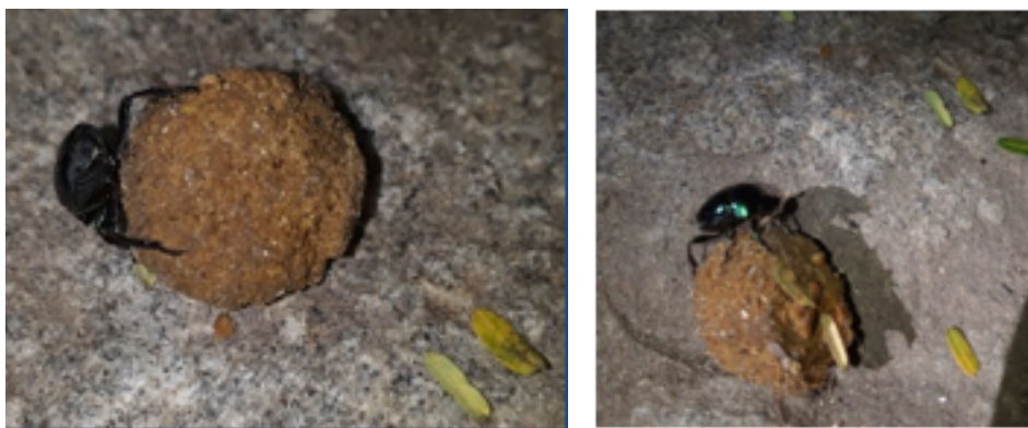
FIGURA 3. Um escaravelho ou rola-bosta ( Canthon latipes ) 20 em ação, empurrando a bola de fezes de cão com cerca de 2 cm de diâmetro na cidade de Niterói, estado do Rio de Janeiro. As suas patas dianteiras dão propulsão ao movimento e as patas traseiras (esquerda) conduzem o material. A foto à direita ilustra o rola-bosta em cima da bola de fezes feita pelo mesmo.

No caso de animais, a coprofagia pode estar especificamente relacionada à retirada de marcadores de território - caso de cães - ou envolver, de modo mais abrangente, a obtenção de alimento - caso dos besouros conhecidos com rola-bosta (FIGURA 3).