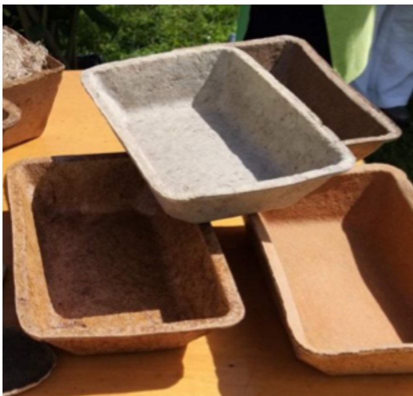
FIGURA 3. Protótipos (cuvetes) em biocompósito de fibra e matriz de conteira.

de repor e se avolumam os problemas da poluição com microplásticos, o uso desta matéria-prima apresenta uma grande cumplicidade com os princípios da proteção da biodiversidade e da redução da poluição. Os produtos são biodegradáveis (ou compostáveis) em apenas 60 dias, e são adequados para embalagens que contactem com alimentos, assim como para servir pratos quentes e frios, sendo também resistentes à água. Não produzem resíduos que necessitem de tratamento, podendo no término da sua utilização ser usados como fertilizante de solos, completando o ciclo perfeito inerente aos princípios da economia circular.