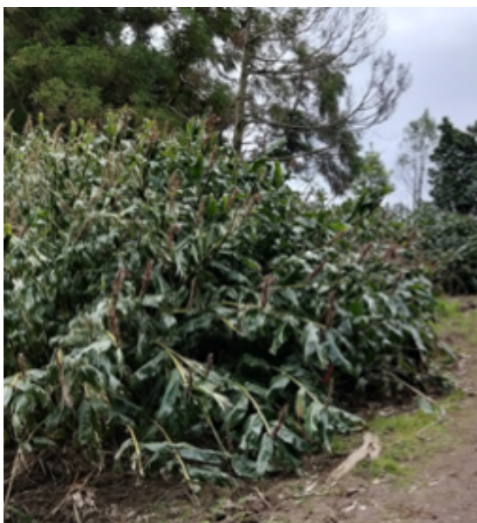
FIGURA 1. Terreno invadido por conceira (Ilha de S. Miguel, 2019).

Nos Açores, a planta Hedychium gardnerianum 1 , ou conteira, como é vulgarmente conhecida no arquipélago, destaca-se na paisagem pela sua enorme abundância (FIGURA 1).