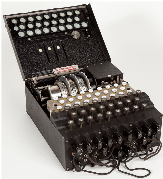
FIGURA 2. Máquina Enigma exposta no Museo Nazionale Scienza e Tecnologia Leonardo da Vinci, Milão.

Na cifra Enigma, a chave consiste no estado inicial da máquina, ou seja, a colocação e posicionamento de várias das suas componentes. Para decifrar uma mensagem cifrada numa máquina Enigma é necessário saber exatamente qual a configuração inicial da máquina que cifrou a mensagem. Usando ideias de várias áreas da matemática, nomeadamente Teoria de Grupos, que estuda, em particular, propriedades das permutações, alguns matemáticos “quintessencialmente puros” [1, p. 299], habituados a “pensar em espaços abstratos multidimensionais” [7, p. 199], conseguiu conceber métodos que foram múltiplas vezes bem sucedidos para encontrar as chaves usadas em certos dias por várias unidades militares alemãs.