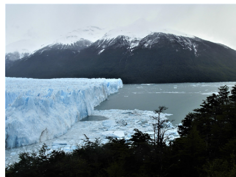
FIGURA 1. Glaciar Perito Moreno.

O Plistocénico representa um intervalo muito recente da história da Terra, situando-se entre os 2,58 milhões de anos e os 11,7 mil anos (Ka). Caracteriza-se por variações climáticas abruptas, contando-se várias fases glaciares e interglaciares. Liderada por Sarah Shackleton da Scripps Institution of Oceanography , acaba de ser publicada na revista Nature Geoscience (DOI: 10.1038/s41561-019-0498-0) uma nova contribuição relativa ao período interglaciar, ocorrido anteriormente à última glaciação, ou seja, entre os 129 e 116 Ka. Suportadas na