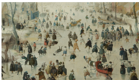
FIGURA 1. Paisagem de inverno com patinadores. (Hendrick Avercamp, 1608).

Todos temos a experiência de que uma superfície de gelo é muito escorregadia. Esta característica é usada na patinagem sobre gelo onde o patim desliza quase sem atrito. A explicação mais usual é que a pressão do patim sobre o gelo provoca uma fusão local com imediato congelamento da água libertada. Esta explicação falha porque, a temperaturas baixas, seria preciso um peso descomunal para provocar a fusão do gelo.