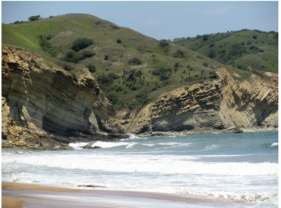
FIGURA 2. Aspeto dos dobramentos, pós-deposicionais, observados a sul da Praia da Hanha.