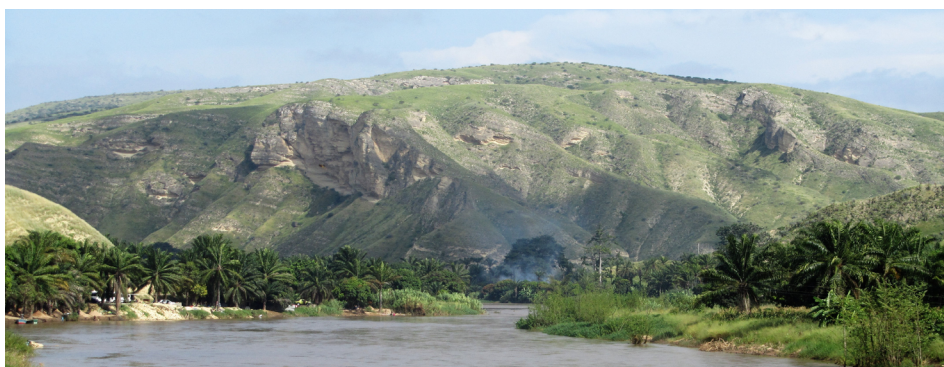
FIGURA 8. Bela paisagem do rio Catumbela junto à cidade do mesmo nome. Ao fundo, as serranias com as unidades carbonatadas de idade cretácica.

Deixamos o eixo Lobito – Catumbela, que nos prendeu algum tempo (mas bastante longe do que seria necessário com vista a observações mais exaustivas), e damos um salto até à extremidade sul da Bacia de Benguela, para lá da cidade capital da província. E mudamos de registo estratigráfico e sedimentológico. O pequeno alargamento da mancha da bacia, que se verifica entre Benguela e o Dombe Grande, ganha no registo de sedimentos mais recentes, nomeadamente de unidades do Cenozoico 3 . Na zona costeira são vários os locais de interesse, embora mais na perspetiva lúdica, tendo em conta as belas praias aqui existentes e onde sobressaem a Baía Azul e a Caotinha. Em termos iconográficos escolhemos esta última, pois é aquela que tem melhores vistas e melhor geologia. Um mar de aparência verdadeiramente tropical, com arribas muito bem desenvolvidas e despidas de vegetação (FIGURA 9). As rochas são predominantemente arenosas, sendo datadas do Paleogénico ao Quaternário 3 . Mais a sul, atravessamos o Dombe Grande, povoação conhecida pela devoção macumbeira, um lugar igualmente cantado em Caboledo pelo músico Paulo Flores. Tal como a Caotinha !