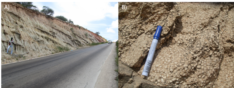
FIGURA 6. A Formação de Tuenza (igualmente do Albiano), junto à Estrada nacional 100, nas proximidades da cidade do Lobito. A) Contraste de cor das unidades predominantemente siliciclásticas; B) Ocorrência de nível oncolítico.

Por cima da Formação de Tuenza vislumbra-se a passagem à Formação de Catumbela, com rocha muito mais competente, que está na origem da serra que se alonga sobranceiramente à cidade do Lobito e se estende paralelamente à costa atlântica. Porém, a melhor percepção geomorfológica e também sedimentológica desta última unidade pode ser captada uns quilómetros mais a sul, nas grandiosas margens do rio Catumbela, de onde provém o nome da formação (FIGURA 7). O bordo norte do rio, antes deste se espriar em terrenos quaternários e chegar à sua foz, mostra mais umas sucessões das formações albianas onde, mais uma vez, não faltam imagens de imensa magnitude (FIGURA 8).