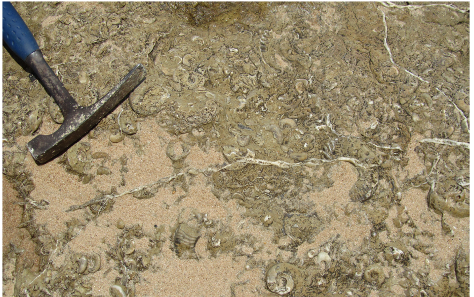
FIGURA 4. Nível de acumulação de fósseis de amonites que permitem datar os sedimentos do Albiano (Formação de Quissonde, Praia da Hanha).

Entretanto, chegamos ao Lobito, uma cidade portuária, cuja identidade se deve muito à sua restinga. Um cordão de areia totalmente antropizado e, previsivelmente, com a mesma orientação das morfologias costeiras, citadas na região de Luanda 1 , atendendo a que os efeitos da deriva litoral são exatamente os mesmos. As arribas costeiras, essas, continuam calcárias através da unidade que parece ser interminável: a Formação de Quissonde. Estamos numa região com imensas pedreiras que aproveitam o enorme potencial de recurso das formações carbonatadas albianas (incluindo a Formação de Catumbela), desde cimenteiras (considerando o domínio dos margo-calcários), até explorações artesanais em plena malha urbana do Lobito (FIGURA 5) 9 .