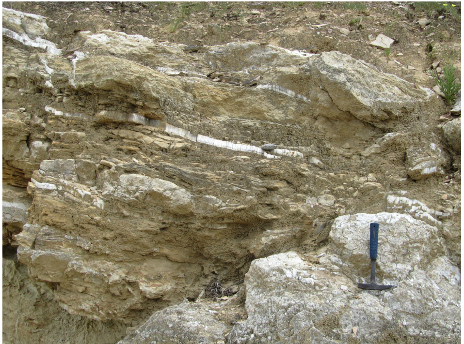
FIGURA 10. Detalhe dos depósitos evaporíticos da Formação Sal Maciço. Salienta-se a ocorrência de níveis centimétricos de gesso fibroso (região do Dombe Grande).