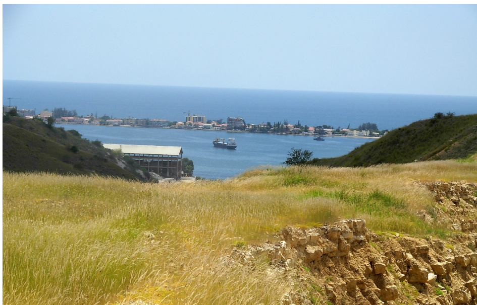
FIGURA 5. Vista parcial da restinga do Lobito, a partir de uma das pedreiras de uma cimenteira.