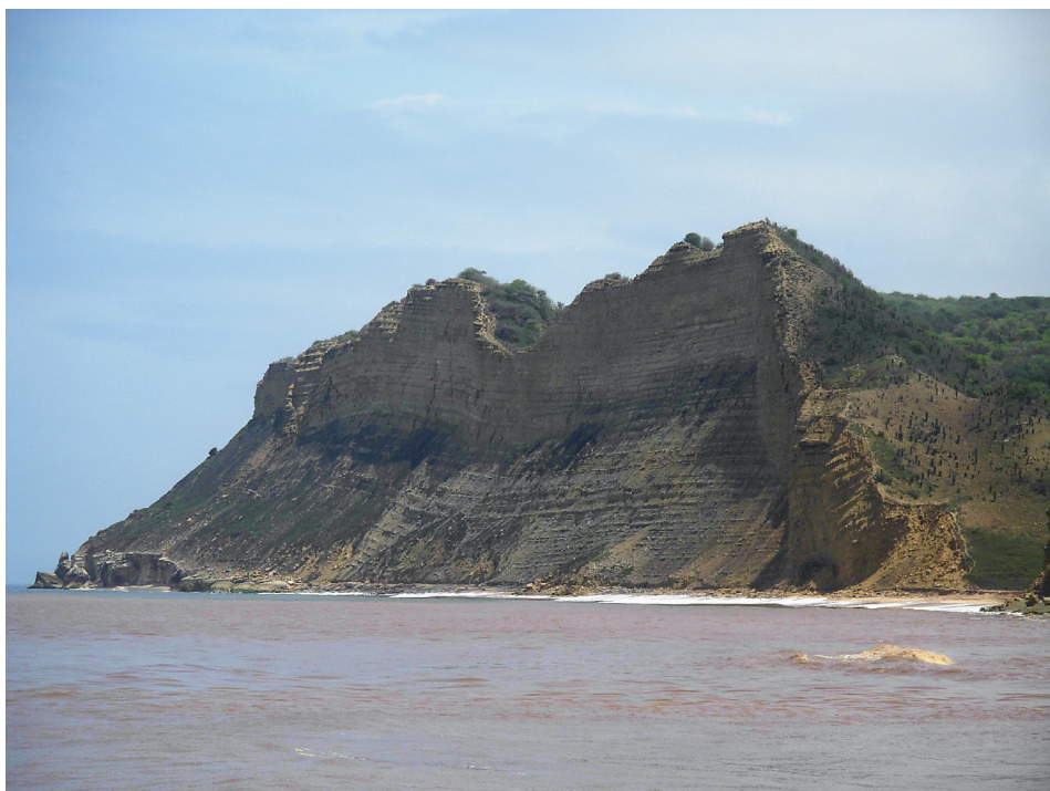
FIGURA 1. Magnitude das arribas margo-calcárias do Albiano (essencialmente da Formação de Quissonde), aflorantes a norte da foz do rio Balombo (Egito Praia).