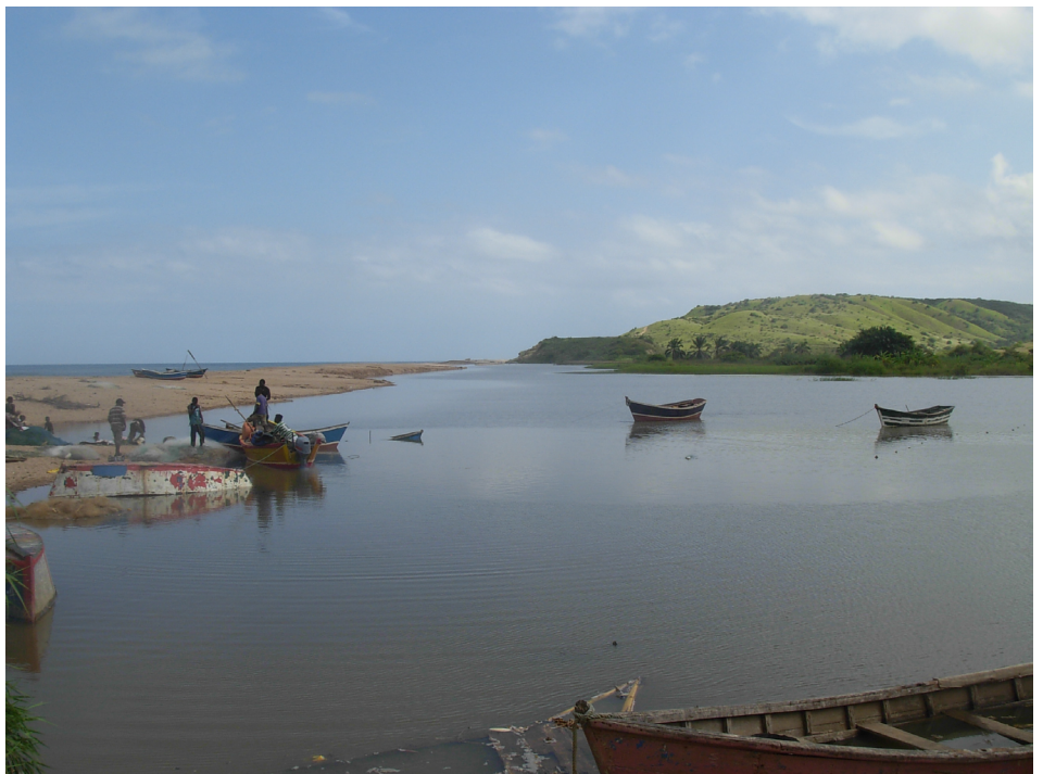
FIGURA 3. O rio Cubal junto à sua foz, correndo paralelamente ao mar. Ao fundo, as arribas cretácicas margo-calcárias.