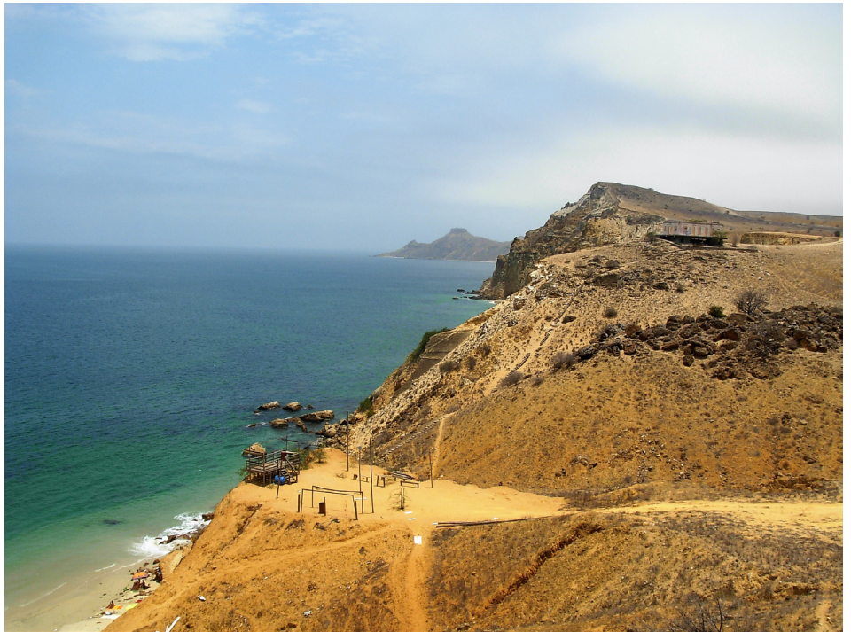
FIGURA 9. A praia da Caotinha com as suas arribas compostas de sedimentos de idade neogénica. Ao fundo, o conhecido e bem icónico morro do Sombreiro.

Poderíamos ir até ao Cuio e passar por mais uns quantos lugares geológicos de exceção, nesta espetacular bacia meso-cenozoica. Que também mostra uma boa sucessão de sedimentos evaporíticos (Formação “Sal Massivo”) (FIGURA 10), que se sobrepõem à Formação do Cuvo 2 . Observações que são fundamentais para o conhecimento evolutivo do Atlântico Sul, ainda mais, considerando a falta de registo onshore de grande parte das bacias conjugadas brasileiras. Mas, está na hora de chegar ao limite meridional da Bacia do Cuanza (o mesmo é dizer, da Sub-bacia de Benguela) e ter o privilégio de observar as unidades siliciclásticas, bem grosseiras (conglomeráticas), da base de todo o enchimento sedimentar. Mais uma vez, e agora com direito a imagem, a Formação do Cuvo, no seu membro mais basal (FIGURA 11), de idade incerta, batizada de pré-Aptiano. Não é preciso muito para as rochas ígneas e metamórficas (do intitulado Complexo de Base) chegarem à zona costeira, formando na cartografia uma pequena franja de rochas do Pré-Câmbrico que delimita a porção norte de uma outra bacia meso-cenozoica: a do Namibe. Apesar de algumas semelhanças genéricas em termos dos enchimentos sedimentares das bacias angolanas, a evolução geológica da Bacia do Namibe é, naturalmente, outra história 11 .