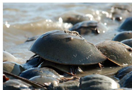
FIGURA 1. Desova do caranguejo-ferradura numa praia atlântica.

O limulus ou caranguejo-ferradura não é de facto um caranguejo nem mesmo um crustáceo, pertencendo à outra ordem dos artrópodes. Como alguns outros crustáceos, aracnídeos e moluscos, o transporte do oxigénio é mediado pelo cobre e não pelo ferro. O caranguejo ferradura usa hemocianina para transportar oxigénio no sangue. A hemocianina é uma metaloproteína com dois átomos de cobre que fixam reversivelmente a molécula de oxigénio. A hemocianina está dispersa no sangue, não estando ligado a células, ao contrário do que acontece com a hemoglobina das hemácias humanas e da