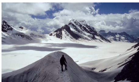
FIGURA 1. Glaciar do pico Gnifetti.

A iniciativa da Universidade de Harvard para a ciência do passado humano ( https://sohp.fas.harvard.edu/ ) declara 536 como o pior ano de sempre para se ter vivido. Terá sido pior que o ano da Peste Negra (1349) e o da Gripe Espanhola (1918). Em 536 um nevoeiro cobriu a Ásia, o Médio Oriente e a Europa e manteve-as na penumbra por ano e meio. As temperaturas daquele verão baixaram 1,5 a 2,5°C tornando-o o mais frio em mais de 2000 anos. Estudos de anéis de crescimento de árvores e agora o estudo do gelo permanente dos Alpes Suíços dá um registo do ambiente ao longo dos séculos. Um cilindro de 72m de gelo alpino regista dois milénios de história, desde erupções vulcânicas a poeiras do Sáara. A erupção de um vulcão na Islândia terá espalhado cinzas que cobriram de nevoeiro o hemisfério norte. Várias substâncias e partículas lançadas na atmosfera formam um aerossol que reflete a luz do sol e arrefece o ambiente prejudicando ou destruindo as culturas, causando fomes e parando a economia. Depois da erupção de 536, outras erupções em 540 e