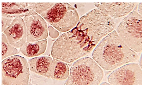
FIGURA 1. Mitose em células do ápice da raiz da cebola.

Mas as que há não chegam? Esta pode ser a pergunta que nos vem à cabeça quando ouvimos falar de células sintéticas. Se a biodiversidade celular já é tão grande qual o interesse de termos células criadas em laboratório? E para que servem, afinal? As células eucariotas são entidades complexas, com um grande número de organitos, e onde inúmeras reações decorrem simultaneamente, o que torna difícil analisar mecanismos celulares e moleculares subjacentes a determinadas