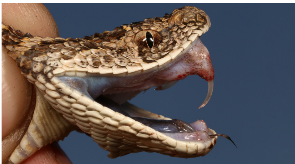
FIGURA 1. Exemplar de Surucucu, Bitis arietans , de Angola.

Este reconhecimento levou a que muito recentemente, em 2017, a OMS tenha classificado o envenenamento por mordida de serpente como uma Doença Tropical Negligenciada de Categoria A, a mais alta e severa das categorias usadas para classificar este tipo de doenças.