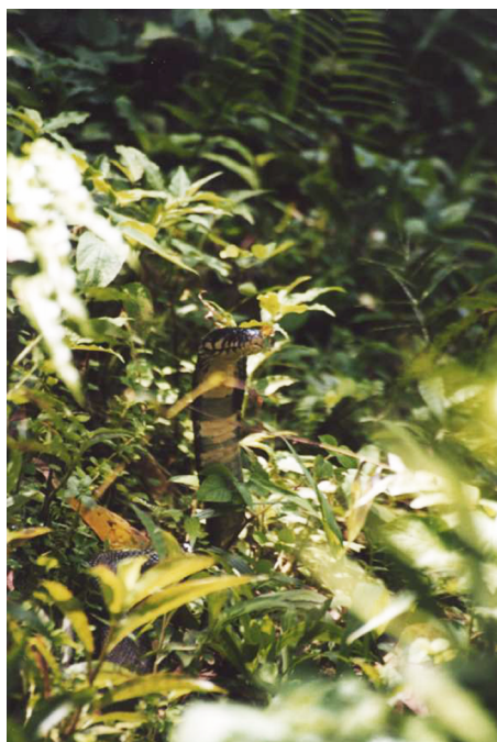
FIGURA 4. Cobra Preta de São Tomé, Naja (Boulengerina) peroescobari .

O caso da Cobra-Preta de São Tomé, endémica da ilha que lhe dá o nome, é paradigmático do atual estado de conhecimento sobre a herpetofauna dos PALOPs, e, muito em particular, das espécies de serpentes venenosas. Conhecida desde os primeiros dias da colonização Portuguesa da ilha, a Cobra-Preta é um dos animais mais icónicos da ilha, fazendo parte integrante da cultura local. Com cerca de dois metros de comprimento total, uma cor dorsal preta-brilhante e um "colar" branco no pescoço, a espécie é inconfundível e a sua perigosidade é conhecida e assegurada por todos os locais (FIGURA 4).