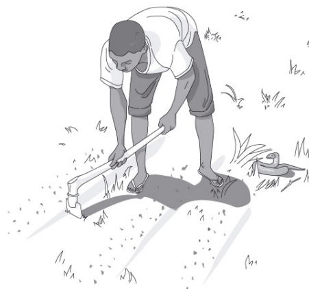
FIGURA 2. Muitos dos acidentes ofídicos ocorrem durante atividades agrícolas.

como a leishmaniose visceral, a lepra, a boubã, a doença das chagas, a doença do sono e a úlcera de Buruli juntas 1 . Para além dos acidentes fatais, muitos dos casos de mordida por serpente venenosa resultam em casos de incapacidade ou desfiguração permanente das vítimas, tornando-as também num problema de carácter humanitário. Esta situação é tão mais grave, tendo em conta que a maior prevalência e risco de acidentes do género são as áreas rurais mais pobres, tendo a OMS estimado que cerca de 20 a 40% das vítimas deste tipo de acidentes em África sejam crianças, seguido por trabalhadores rurais e agricultores 2 (FIGURA 2).