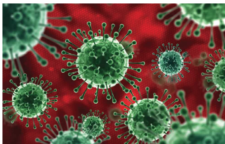
FIGURA 1. Vírus de SARS-CoV-2.

Os resultados de um primeiro ensaio de esteróides inalados, contra a COVID-19, conduzido por uma equipa de investigadores no Instituto de Investigação do Centro para a Saúde da Universidade McGill, Montreal, em colaboração com cientistas do Centro Sunnybrook para as Ciências da Saúde de Toronto, Instituto de Investigação em Saúde do Litoral de Vancouver e a Universidade da Columbia Britânica em Vancouver, mostram que os corticosteróides inalados para ajudar jovens saudáveis com COVID-19, a melhorar mais rapidamente, não têm resultados superiores aos de placebo.