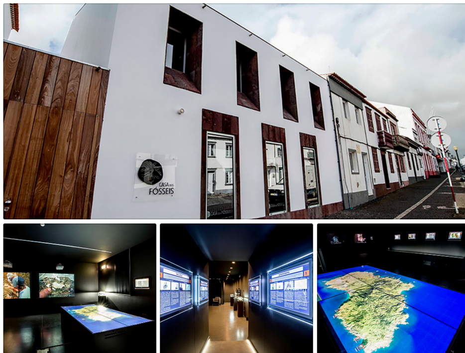
FIGURA 1. O Museu Casa dos Fósseis em Vila do Porto, na ilha de Santa Maria (Açores).

Vamos exemplificar tudo o que atrás foi dito, através de um caso de estudo. A Macaronésia é uma ampla área geográfica localizada no Atlântico norte, onde estão cinco arquipélagos: Açores, Madeira, Selvagens, Canárias e Cabo Verde. No total, nesta região, existem 31 ilhas de maior dimensão e muitos ilhéus e montes submarinos (FIGURA 2).