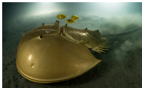
FIGURA 1. Fotografia vencedora de um caranguejo-ferradura com carapaça protetora dourada, acompanhado por um trio de peixes juvenis durante a sua procura por alimento. (Galeria completa de imagens em https://www.nhm.ac.uk/wpy/gallery )

O fotógrafo Laurent Ballesta é autor de vários livros de fotografia sobre vida selvagem subaquática. É um dos co-fundadores da Andromède Océanologie , instituição dedicada a atividades de investigação, divulgação e conservação do meio aquático, e líder de expedições marinhas há mais de 10 anos. Ilustra particularidades do mundo subaquático tanto como naturalista como artista.