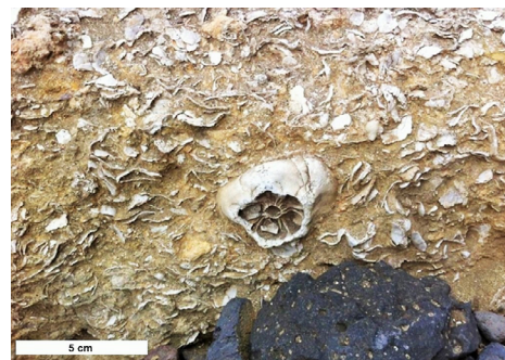
FIGURA 1. Imagem representativa dos milhões de fósseis de ouriços que se podem encontrar na jazida da Pedra-que-pica, notavelmente adjacente a material vulcânico de cor mais escura (canto inferior direito).

O património geológico e paleontológico de Santa Maria é meritório de interpretação e divulgação que seja acessível a todos. As suas jazidas fossilíferas são um laboratório natural de relevância internacional, objeto de numerosos estudos científicos no âmbito de colaborações internacionais. Assim, o Plano de Ação do Paleoparque de Santa Maria prevê um investimento considerável na instalação de um cais amovível para acostagem de embarcações na Pedra-que-Pica e na Gruta dos Icnofósseis. Outras ações de conservação, monitorização, promoção do paleoparque dos fósseis de Santa Maria serão promovidas entre 2023 e 2026, incluindo a divulgação nos voos da SATA.