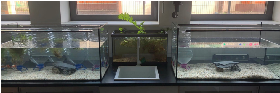
FIGURA 2. Montagem experimental, com o aquário-piloto à esquerda e o aquário-controlo à direita.

Na FIGURA 2 pode observar-se a montagem experimental com o aspeto inicial, em 9 de março.