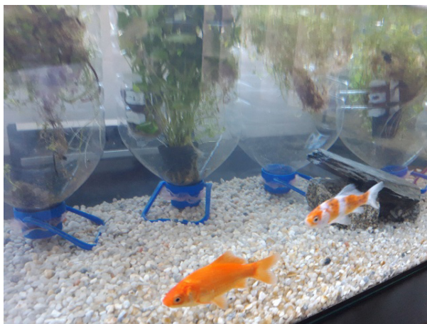
FIGURA 3. Aspeto do aquário-piloto, no final.

Nas FIGURAS 3 e 4 estão evidenciados, respetivamente, o aspeto final do aquário-piloto e o aspeto final do aquário-controlo, em 20 de abril. É notório o aspeto límpido da água e do vidro frontal do aquário-piloto (FIGURA 3), o aspeto mais túrbido da água e a presença de microalgas no vidro frontal, no caso do aquário-controlo (FIGURA 4).