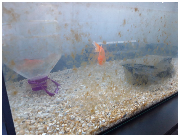
FIGURA 4. Aspeto do aquário-controlo, no final.