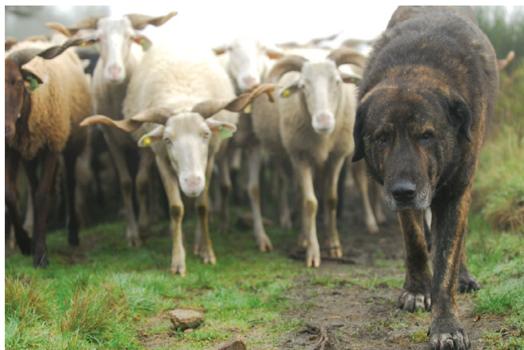
FIGURA 1. Fotografia de um exemplar de Cão da Serra da Estrela de pêlo curto.

Portugal apresenta um extenso património biológico animal. Existem múltiplas raças de bovinos (15), ovinos (16), caprinos (6), suínos (3), equídeos (6), galináceos (5), canídeos (11) e até de abelha (1) 16 .