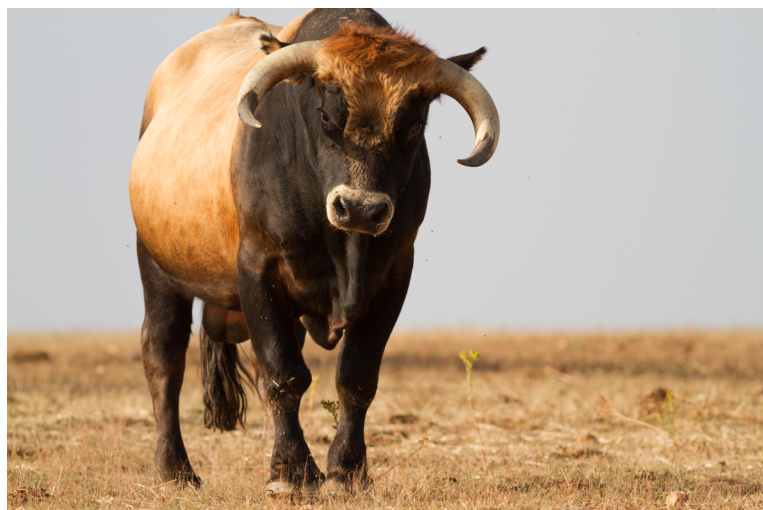
FIGURA 2. Fotografia de bovino autóctone da raça Mirandesa.

Como todos sabemos, a nível mundial, a exploração intensiva dos animais úteis para a alimentação humana tem um lado negro em termos de bem-estar animal e de consequências nefastas para o meio ambiente, como sejam condições de cativeiro e falta de pastagens ao ar livre, seleção sexual que implica o abate de indivíduos, remoção das crias lactentes em idade precoce, crescimento acelerado com reforço de antibióticos, etc. Infelizmente, muitas raças autóctones enfrentam risco de extinção devido a alterações profundas no meio rural e nas práticas de agricultura tradicionais. Uma das principais consequências traduz-se na redução dos efetivos populacionais destas raças (número de animais reprodutores), também, como resultado da sua substituição e/ou ao cruzamento com raças comerciais transfronteiriças (diluição genética). Um exemplo paradigmático é o dos bovinos de raça Marinhoa, cuja principal atividade estava associada à pesca artesanal — na Arte Xávega — apesar de serem tradicionalmente explorados para várias aptidões, como sejam o trabalho nos campos agrícolas e a produção de vitelos e leite para consumo humano, a crescente mecanização e substituição pela raça Holstein-Frísia na produção leiteira, terão contribuído para o seu declínio.