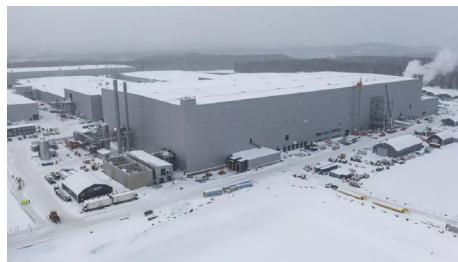
FIGURA 1. A fábrica da Northvolt, no norte da Suécia, teve um desempenho abaixo da sua capacidade de produção.

Esta empresa de produção de baterias para automóveis, fundada em 2016, anunciou recentemente um passo importante no desenvolvimento de um modelo de bateria que substitui minerais críticos como o lítio, cobalto, níquel e grafite por sódio, muito abundante na Natureza e com um custo de extração muito baixo. Esta inovação é significativa porque pode reduzir a dependência dos países ocidentais da China para tecnologias limpas e resolver os danos sociais e ambientais associados à extração e refinação de minerais para baterias. Infelizmente, a competição entre empresas deste sector a nível mundial é feroz e a Northvolt sueca acaba de apresentar o pedido de falência porque não conseguiu garantir as condições financeiras necessárias para continuar a laborar nos mesmos moldes.