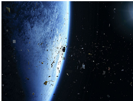
FIGURA 1. O problema dos detritos espaciais só está a piorar. A ESA diz que não temos tecnologia para lidar com isso. Também podemos não ter a coesão política necessária.

O problema dos detritos espaciais começa a atingir níveis preocupantes, e a Agência Espacial Europeia (ESA) reconhece que carecemos da tecnologia e da coesão política para o resolver. A ESA publicou um Zero Debris Technical Booklet (Caderno Técnico Zero Detritos) que descreve os desafios e propõe algumas soluções. O primeiro passo é deixar de criar mais detritos, evitando libertações não intencionais, melhorando os materiais para resistir à degradação e aos impactos, e desenvolvendo sistemas de propulsão alternativos que não libertem partículas pequenas. A melhoria da Vigilância e Coordenação do Tráfego Espacial (STC) é também necessária para prevenir colisões. Relativamente aos detritos existentes, a sua remoção será necessária. Isto requer a avaliação de satélites extintos e o desenvolvimento de métodos fiáveis para os desorbitar, incluindo sistemas ativos de remoção de detritos. A prevenção de colisões é também crucial,