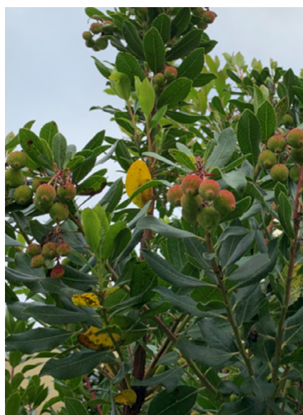
FIGURA 3. Folhas precocemente senescentes, de cor amarela, no meio das folhas verdes normais.

faz com que a folhagem chegue aos cursos de água. Ao contrário das caducifólias típicas dos sistemas ripícolas (e.g., amieiro, freixo, choupo e salgueiro 17 ) que perdem as suas folhas no outono, no medronheiro este processo ocorre durante todo o ano. As características das suas folhas maduras, incluindo uma cutícula espessa, a presença de ceras, dureza elevada e altas concentrações de fenóis retardam a decomposição, providenciando um recurso diferente das caducifólias, que de uma forma geral são mais facilmente degradáveis 18 , o que pode contribuir para uma maior diversidade das comunidades de decompositores (microrganismos e invertebrados), quer em meio terrestre quer nos sistemas aquáticos. Comparando os sistemas de produção de medronheiro em monoculturas com outras espécies, como o eucalipto, que fornece uma folhada ao longo do ano com algumas características semelhantes (elevada dureza, compostos fenólicos), a folhada do medronheiro pode ter características ecológicas.