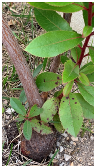
FIGURA 2. Lignotúber na base de uma planta de medronheiro.

Devido à sua rusticidade consegue desenvolver-se em solos rochosos, pobres em matéria orgânica, e onde a água é escassa (FIGURA 1 B)). Além disso, apresenta um sistema radicular desenvolvido e profundo, o que contribuiu para a estabilização de terrenos instáveis 3 , particularmente em zonas íngremes. A sua tolerância a metais pesados, permite também a sua utilização como fitoestabilizador 13 , ou seja, a plantação em solos contaminados, contribuindo para evitar a mobilização de metais tóxicos, reduzir a erosão e promover a recuperação de áreas degradadas. Surge assim como uma solução viável e sustentável para a reabilitação de ecossistemas afetados por atividades mineiras ou industriais.