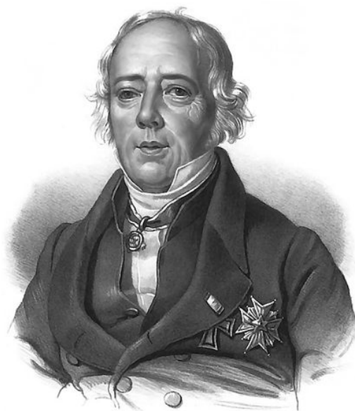
Figura 1. Hans Christian Ørsted (1777 – 1851).

Hans Christian Ørsted (1777 – 1851), físico e químico dinamarquês, descobriu que a corrente elétrica num fio pode desviar uma agulha magnetizada de uma bússola, um fenómeno cuja importância foi rapidamente reconhecida, inspirando o desenvolvimento da teoria eletromagnética.