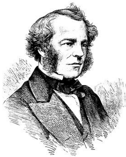
FIGURA 1. George Gabriel Stokes (1819 – 1903).

George Gabriel Stokes (1819 – 1903) foi um físico e matemático britânico que ficou conhecido pelos seus estudos sobre o comportamento de fluidos viscosos, em particular pela sua lei da viscosidade, que descreve o movimento de uma esfera sólida num fluido, e pelo teorema de Stokes, um teorema basilar na análise vetorial.