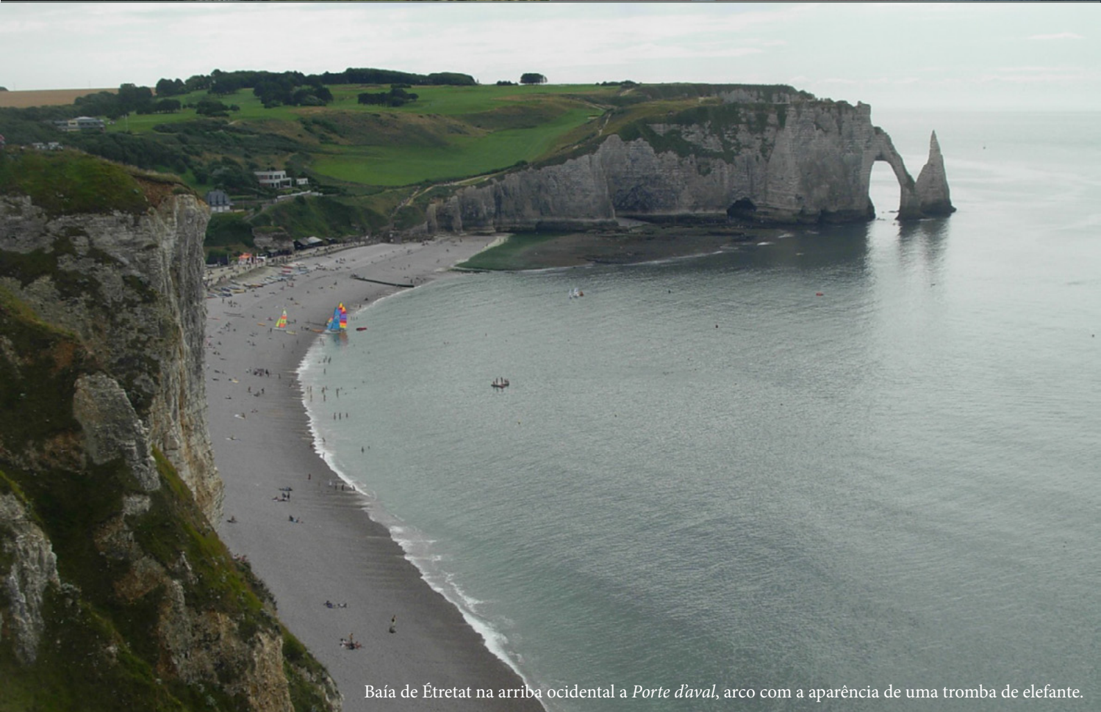
Baía de Étretat na arriba ocidental a Porte d'aval , arco com a aparência de uma tromba de elefante.