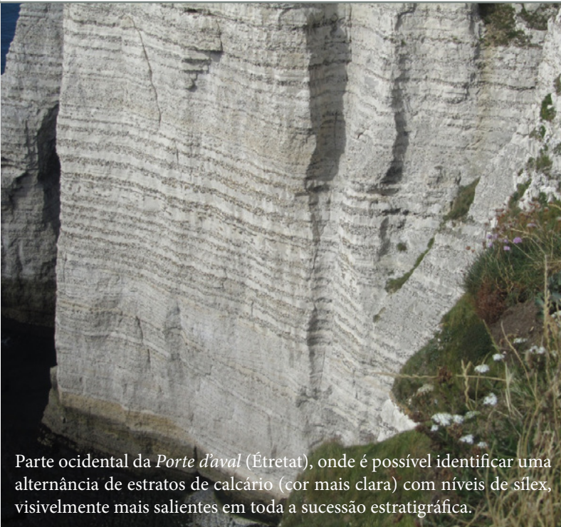
Parte ocidental da Porte d'aval (Étretat), onde é possível identificar uma alternância de estratos de calcário (cor mais clara) com níveis de sílex, visivelmente mais salientes em toda a sucessão estratigráfica.

MARE - Departamento de Ciências da Terra da Faculdade de Ciências e Tecnologia da Universidade de Coimbra