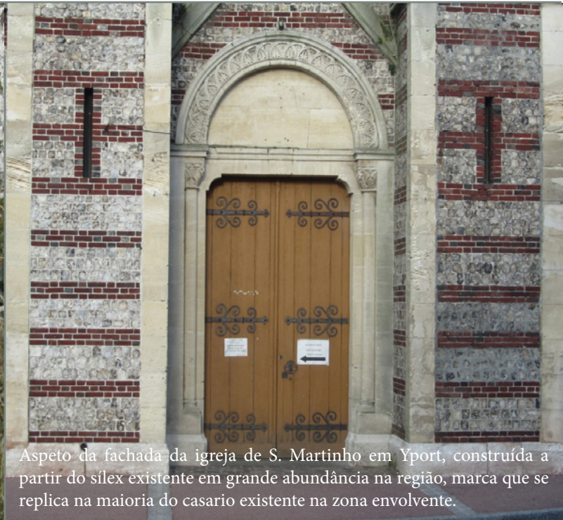
Aspetto da fachada da igreja de S. Martinho em Yport, construída a partir do sílex existente em grande abundância na região, marca que se replica na maioria do casario existente na zona envolvente.