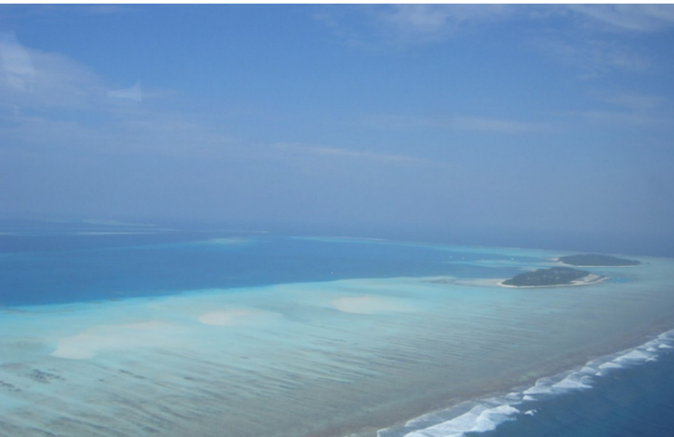
O atol de Malé do Norte na sua porção mais oriental. As ilhas carbonatadas e habitadas de Dhiffushi e Meeru.

MARE - Departamento de Ciências da Terra da Faculdade de Ciências e Tecnologia da Universidade de Coimbra