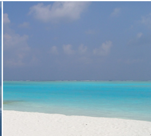
Contraste entre o branco da areia (carbonatada) da praia e o azul turquesa da laguna. Ao fundo, o limite do atol. Uma imagem de marca das Maldivas.