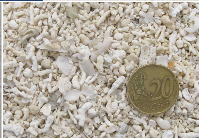
Acumulação recente de praia de fragmentos bioclásticos, resultantes do desmantelamento do recife de coral em épocas de tempestade.