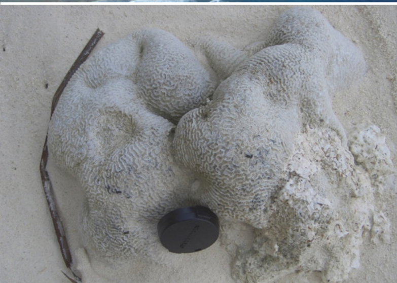
Corais hermatípicos na ilha de Meeru. Uma prova de que o nível do mar esteve mais alto em épocas pretéritas recentes.