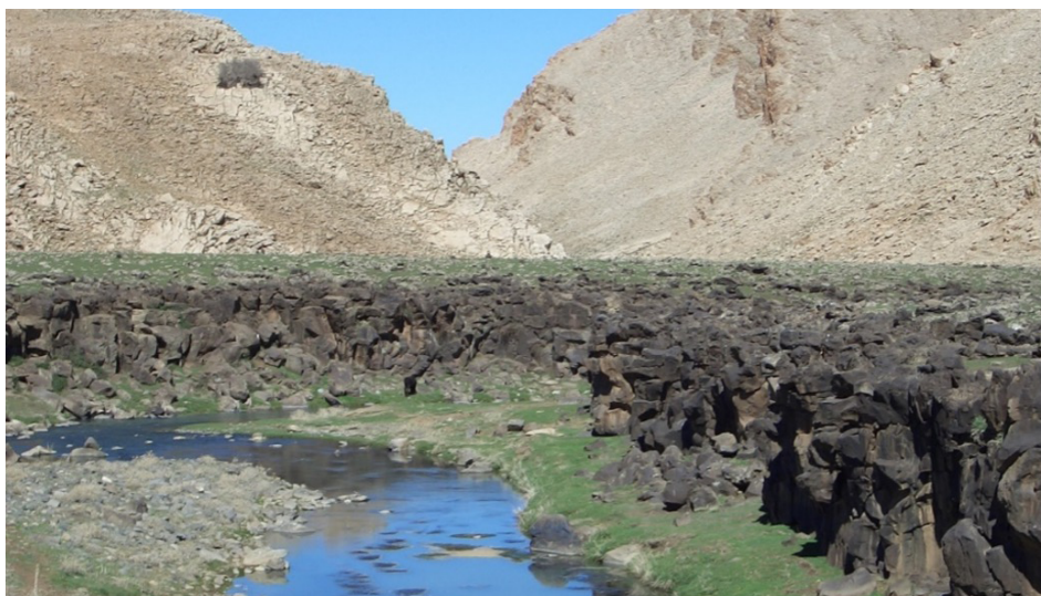
FIGURA 7. Troço do Oued Guigou, junto a Foum Kheneg (crista no fundo da imagem com calcários do Jurássico Inferior), que corta uma planície composta por rocha basáltica do Plio-Quaternário.