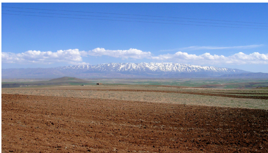
FIGURA 8. O Planalto de Moulouya ilustrando o Jbel El Ayachi na frente norte do Alto Atlas (vista a partir da fronteira sul do Médio Atlas).

Contudo, em matéria de mineralizações não ficamos por aqui. A poucos quilómetros, temos o povoado de Mibladen, localidade mundialmente conhecida devido a uma das variantes mais sugestivas de outro mineral de chumbo, a vanadinite. Um clorovanadato ( \text{Pb}_5(\text{VO}_4)_3\text{Cl} ), bastante atrativo, dados os seus cristais hexagonais avermelhados (FIGURA 9A)). Belas pedras! E isto não é tudo, já que estamos nas imediações de Midelt, a povoação que mais se destaca na região, sob a sombra do grande Jbel Ayachi, e com fortes tradições associadas à geologia.