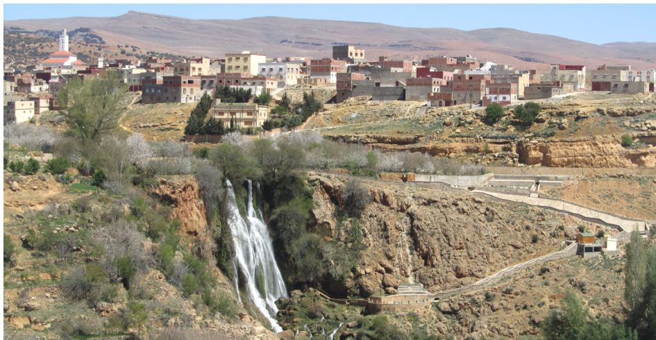
FIGURA 6. A cascata de Imouzzer Marmoucha, sendo visível uma impressionante acumulação de travertino e outras tipologias litológicas afins.

bonita cascata (FIGURA 6). Aliás, o significado de Imouzzer em árabe. Mas a geologia não fica por aqui. Na frente da icónica queda de água aflora uma enorme parede de travertino, o mesmo tipo de rocha que se observa em Fez. Mais carbonato! Ou seja, uma precipitação permanente de carbonato de cálcio, que exemplifica na atualidade (o Holocénico) o que ficou registado na cidade imperial.