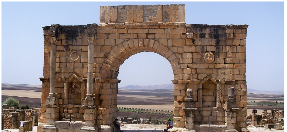
FIGURA 3. Arco de Caracalla nas ruínas romanas de Volubilis, onde o calcário é rei. Porta "escancarada" de acesso à vasta e fértil Planície de Saïss (Cenozoico).

Todavia, as semelhanças geológicas com o centro da Europa não ficam por aqui, já que a morfologia do Rife e do Médio e Alto Atlas estão intimamente relacionadas com a compressão alpina 4 . No "sobe e desce" do Médio Atlas vislumbra-se uma geologia repleta de rochas carbonatadas, mas também siliciclásticas, maioritariamente datadas do Jurássico e Cretácico (também do Cenozoico). Estas unidades imprimem na paisagem os contornos da sua estratificação 5 , resultado de toda uma cronologia de eventos sedimentares, e também tectónicos (FIGURA 4), nem sempre fáceis de explicar - é aqui que entra o geólogo estruturalista para tentar desembrulhar o que a estratigrafia não alcança. Mas, neste caso, nem é preciso. Neste empilhamento sedimentar complexo ressaltam, por vezes, sucessões margo-calcárias que, devido à sua natureza mais branda, preenchem normalmente depressões, resultado dos efeitos erosivos a que foram sujeitas. Consequência de uma origem marinha, relativamente profunda, ocorrem nestas unidades onde dominam o carbonato, os minerais argilosos e o quartzo, fósseis de organismos nectónicos como as amonites e belemnites (FIGURA 5). A ocorrência dos primeiros, constituindo-se importantes fósseis-índice, torna possível uma datação bastante precisa, mas relativa, das unidades, do Pliens-