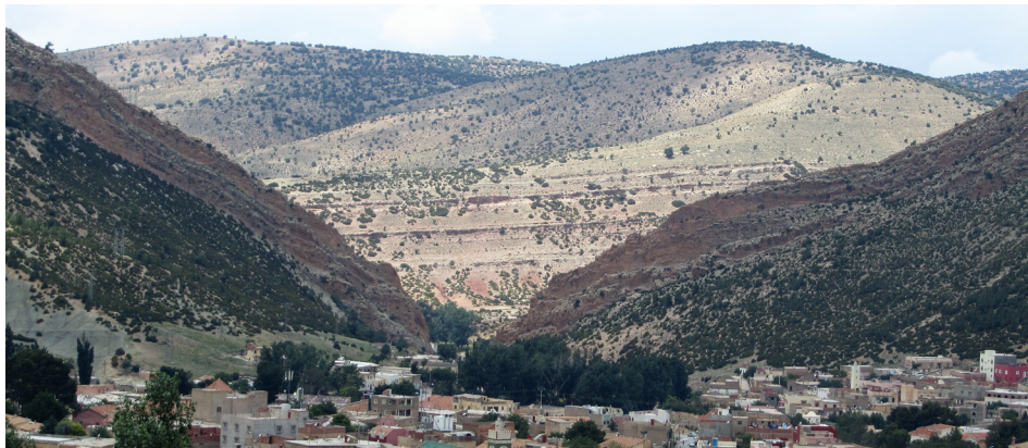
FIGURA 4. A cidade de Boulemane, em pleno Médio Atlas, discernindo-se ao fundo da povoação uma pequena garganta que corta a crista fortemente inclinada de rochas carbonatadas do Jurássico Médio. Na última colina, realça-se uma sucessão de estratos sub-horizontais de idade cretácica.

baquiano - Toarciano, dois andares do Jurássico Inferior 6 . Este facto é importantíssimo, já que potencia o exercício de correlação com outros locais mais distantes, como é o exemplo de Peniche, em Portugal. Aquela que é a referência mundial para o limite entre os referidos andares 7 . Esta comparação permite discutir as variações paleoambientais ocorridas em várias partes do globo, as conexões paleobiológicas entre as diversas bacias sedimentares e configurar o contorno entre os continentes e os ambientes marinhos (paleogeografia) ao tempo da deposição.