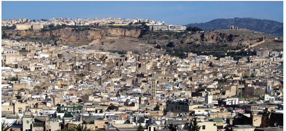
FIGURA 2. A labiríntica cidade de Fez. No topo da colina observam-se afloramentos de travertinos e tufos calcários do Plio-Quaternário. Como pontos de referência no topo da referida colina, os túmulos de Merinides (lado direito) e a Fortaleza do Norte (lado esquerdo).