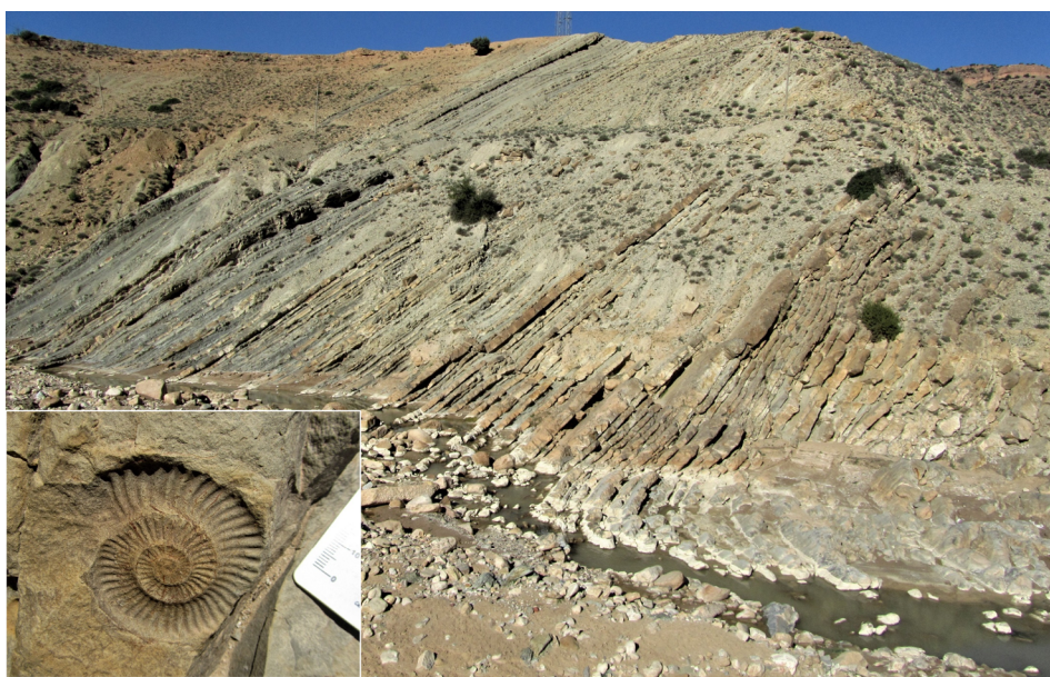
FIGURA 5. Sucessão margo-calcária do Jurássico Inferior da região de Imouzzer Marmoucha (Médio Atlas), objeto de estudo científico. A ocorrência de fósseis de amonites permite datar a sucessão estratigráfica do Pliensbaquiano superior (exemplo da imagem; escala em milímetros) ao Toarciano inferior. Ou seja, rochas com cerca de 185 a 182 milhões de anos (perfil de Aït Moussa).

A poucos quilómetros de Aït Moussa, junto à localidade de Imouzzer Marmoucha, damos um salto gigantesco no tempo. Envolvida por corpos tabulares de natureza carbonatada (a que caracteriza grande parte do Médio Atlas), mais recentes, este local mostra uma