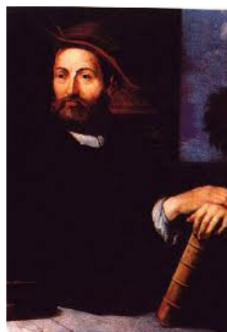
FIGURA 1. Andrea Cesalpino (1524-1603).

Andrea Cesalpino (1524-1603), dedicou-se à medicina e ao estudo da botânica durante sua vida. Sua obra botânica mais expressiva foi De Plantis (1583), onde descreveu cerca de 1.500 plantas em seus quatro volumes. Seus estudos influenciaram profundamente o estudo da sistemática vegetal que se seguiu. Na área médica seus estudos sobre fisiologia cardíaca foram precursores do conceito atual de circulação sanguínea fechada.